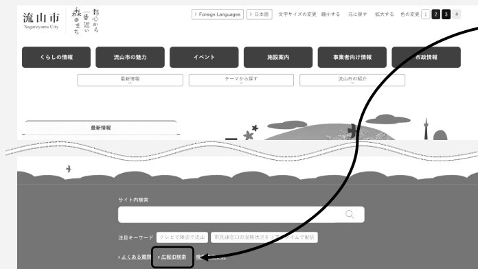
▲ 市ホームページ TOPページ