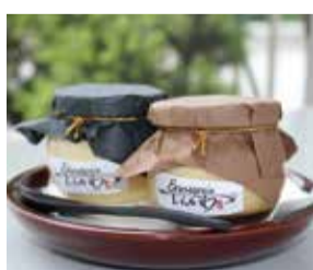
(左)プレミアムプリン (右)みりんプリン (L) Premium Pudding (R) Mirin Pudding

流山にはいろいろなみりんのデザートがあります。今回はみりんプリンとみりんゼリーを紹介します。