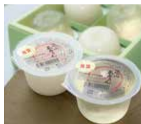
(左)流山本みりんゼリーこぼれ梅入り (右)流山本みりんゼリー (L) Nagareyama Hon Mirin Jelly with Kobore Ume (R) Nagareyama Hon Mirin Jelly