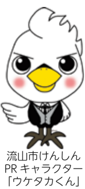
流山市けんしんPRキャラクター「ウケタカくん」