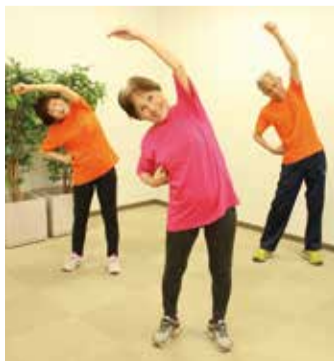
講師のながいき応援団のみなさん

☎高齢者支援課に電話または氏名、年齢、住所、電話番号、希望会場、希望日を明記の上ファクス