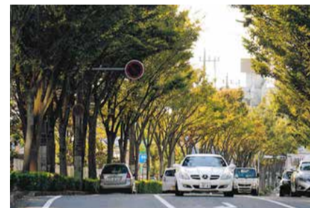
第5回流山市景観賞・街並み部門受賞「榎の並木通」