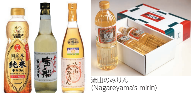
流山のみりん (Nagareyama's mirin)

私はいつも「みりん」を日本料理に使っていましたが、流山に来るまで、みりんが色々な味を出すことに気付かなかったです。これからはみりんについて知りたい!