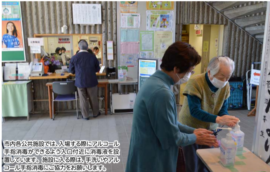
市内各公共施設では、入場する際にアルコール手指消毒ができるよう入口付近に消毒液を設置しています。施設に入る際は、手洗いやアルコール手指消毒にご協力をお願いします。