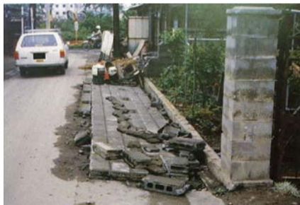
基準が守られていないブロック塀が倒壊した様子

平成30年6月に発生した大阪北部地震では、登校中の児童が倒壊したブロック塀の下敷きになり、亡くなるという痛ましい事故が起きました。一見安全そうに見えるブロック塀も、一度倒壊すると大きな事故につながる危険性があります。ブロック塀による事故が二度と起こらないように、ご自宅のブロック塀の自主点検をお願いします。