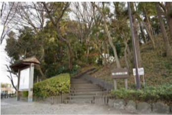
主郭に当たる大地の突端部を整備した前ヶ崎城跡公園

NPO法人流山史跡ガイドの会の皆さんと一緒に自分の足で史跡を巡り、流山市の歴史を学ぶことで地域の新しい発見をするイベントです。今回は江戸時代に城主の高城氏が治めていた小金城、名都借城、前ヶ崎城の城跡を巡ります。 日 4月26日(日) 9時～12時30分 所 流鉄流山線小金城趾駅(集合) ▷コース=小金城趾駅→小金城跡→広徳寺→名都借城跡→清龍院→前ヶ崎城跡→流山免許センター(約6km。現地解散) 定 40人(先着順) 費 無料 持 動きやすい服装、飲み物 申 文化会館へ電話 問 文化会館 ☎7158-3462