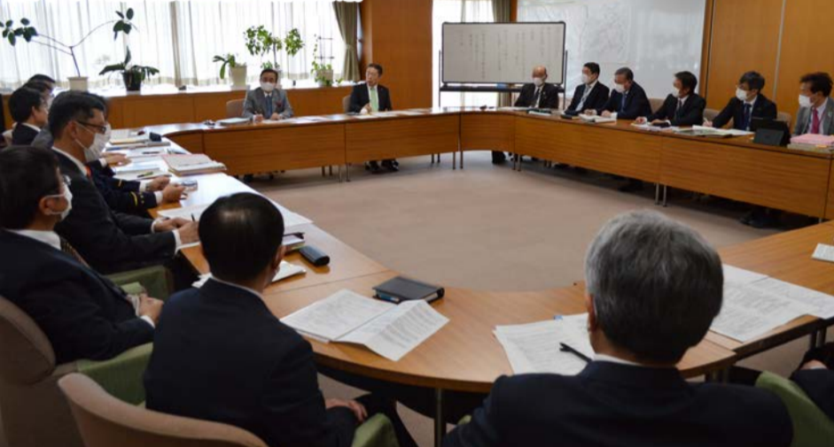
3月24日、市役所で新型コロナウイルス感染症対策連絡会議を開催。感染症に係る本市の対応や市主催のイベント・集会などの取り扱いを定めました。

市では、新型コロナウイルス感染症により利用を中止していた公共施設の一部を、4月1日から再開していきます。利用にあたっては、市が主催するイベントなどの取り扱いをご確認いただき、感染症予防にご理解・ご協力をお願いします。 ID 1024458