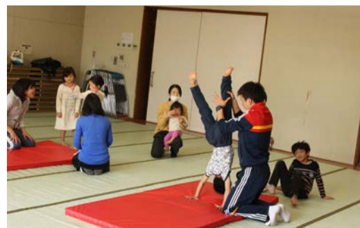
逆立ちを練習する子どもたち