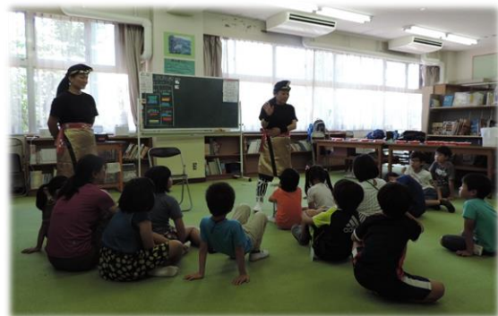
体験学習カリキュラムの様子 (夏休みの学校開放による「子どもの居場所づくり」事業)