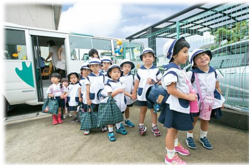
送迎保育ステーションを利用する子ども達 （送迎保育ステーション事業）