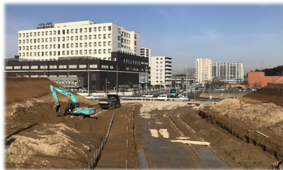
都市計画道路中駒木線工事状況 (運動公園周辺地区一体型特定土地区画整理国費対象市負担事業)