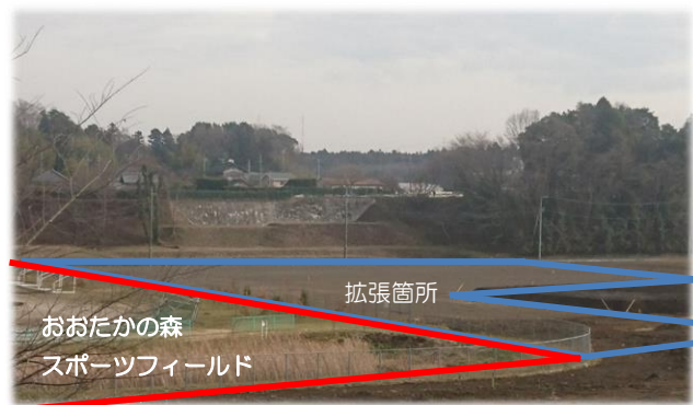
おおたかの森スポーツフィールド拡張箇所 (スポーツフィールド整備事業)