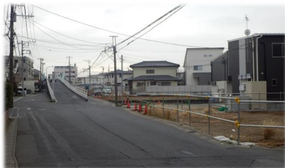
名都借跨線橋側道整備箇所 (名都借跨線橋道路拡幅改良事業)