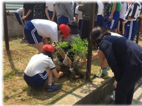
グリーンウェイブによる植樹（東深井小学校） （生物多様性地域戦略推進事業）