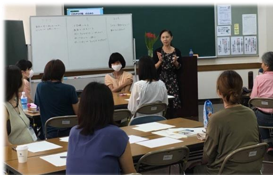
女性のためのキャリア支援講座の様子 (男女共同参画社会づくり事業)