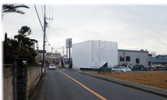
市道71068号線歩道拡幅箇所 (東小学校前通学路道路拡幅整備事業)