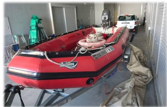
水災害で活動する南消防署の救助艇 (救助艇整備事業)