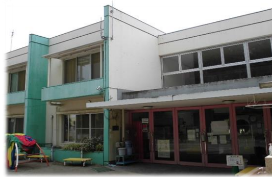
老朽化が進んだ東深井保育所の建物全景（正面玄関） （保育所改修事業）