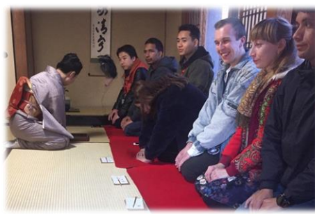
チーバくん大使モニターツアー (外国人観光客誘致促進事業)