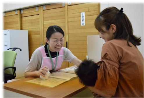
保健師による子育ての不安や困りごとなどの相談対応の様子 （妊娠・出産・子育てサポート事業）