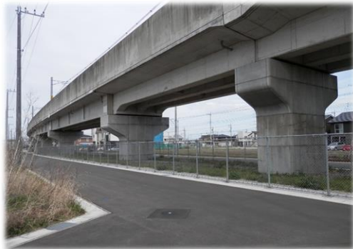
駐車場として整備するつくばエクスプレスの高架下 （おおたかの森センター施設整備改修事業）