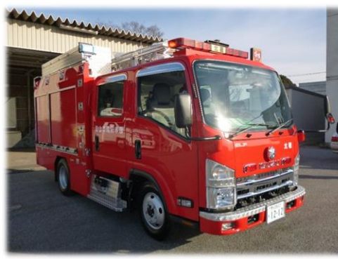
高機動でコンパクトなCD-I型の車両（写真は北消防署車両） (消防ポンプ自動車整備事業)