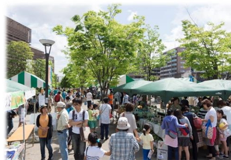
「森のマルシェ」の開催（流山おおたかの森駅南口都市広場） （市のイメージ向上と企業・住民誘致の推進事業）