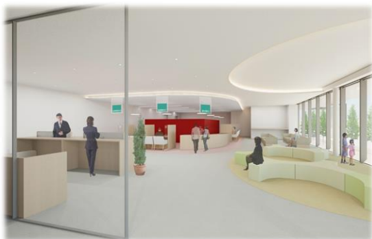
おおたかの森市民窓口センターのイメージ (おおたかの森市民窓口センター整備事業)