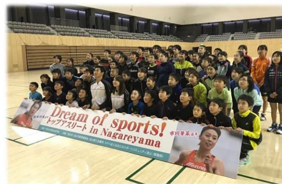
トップアスリートと子どもたちとの交流 (東京オリンピック・パラリンピック事前キャンプ地等誘致事業)