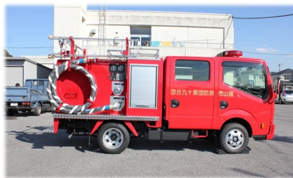
更新整備する第20分団の車両（写真は第19分団車両） (消防団小型動力ポンプ積載車整備事業)