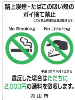
路上喫煙防止重点区域内啓発路面シール （路上喫煙等防止事業）