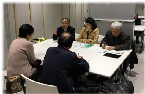
高齢者の住み替え相談会の様子 (高齢者住み替え支援相談事業)