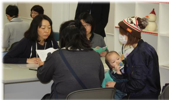
おおたかの森ファミリーサポートセンターでの相談業務の様子 (ファミリーサポートセンター支援事業)