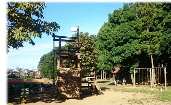
東部近隣公園内の木製遊具 (既成市街地地区公園施設新設事業)