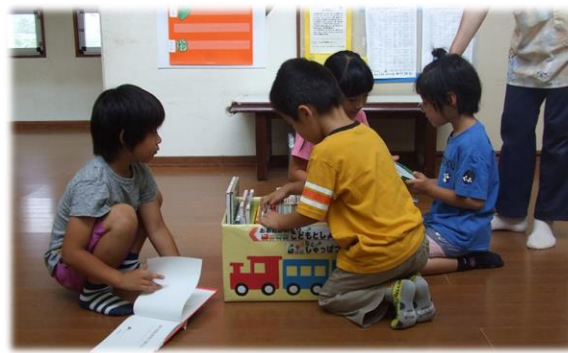
届いた絵本を楽しむ子どもたち (おおたかの森こども図書館資料充実事業)