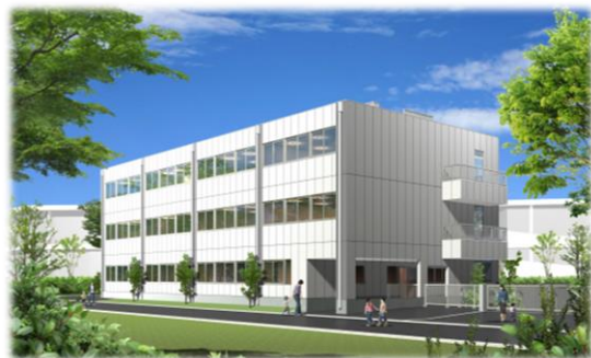
おおたかの森学童クラブのパス図 (学童クラブ施設整備事業)