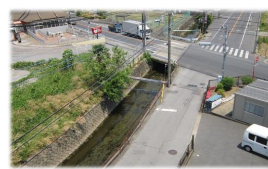
和田堀都市下水道改修予定箇所 (三輪野山総合治水対策事業)