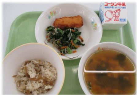
地元流山産の1等米コシヒカリを使った学校給食 (学校給食地産地消推進事業)