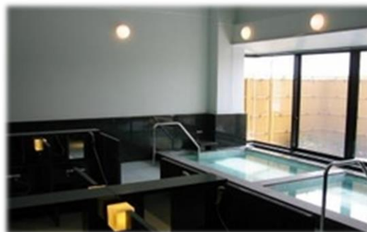
下花輪福祉会館の浴槽 (福祉会館整備事業)