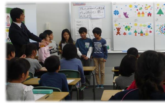
小学校の外国語活動の授業の様子 (小学校英語活動推進事業)