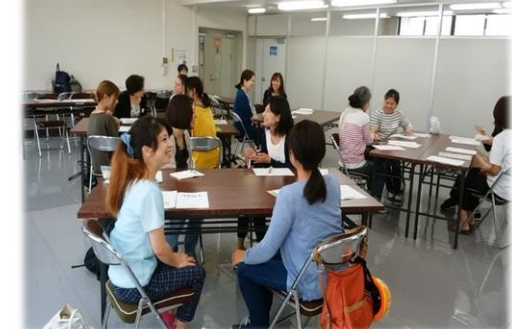
「子育てお母さん就職支援セミナー」での課題演習シーン （就労支援セミナー企画運営事業）