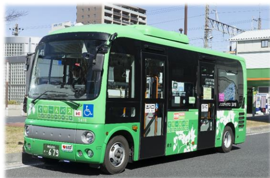
市内を循環するぐりんバス (ぐりんバス運行事業)