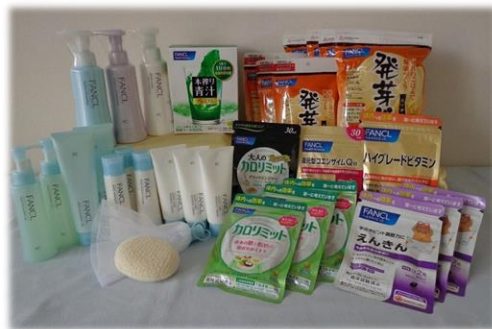
ふるさと納税返礼品ファンケルSセット （ふるさと納税市内特産品等贈呈事業）