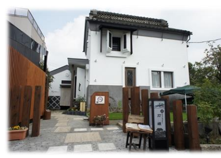
古民家リノベーション（カフェ+ギャラリー灯環） (流山本町・利根運河ツーリズム推進事業)