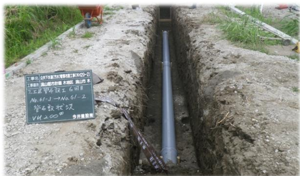
木地区汚水整備 (地区内汚水整備事業)