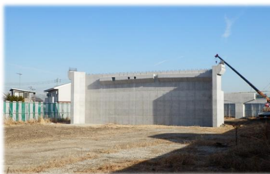
流鉄流山線交差部橋梁架設箇所 (都市計画道路3・3・2号新川南流山線立体交差事業)