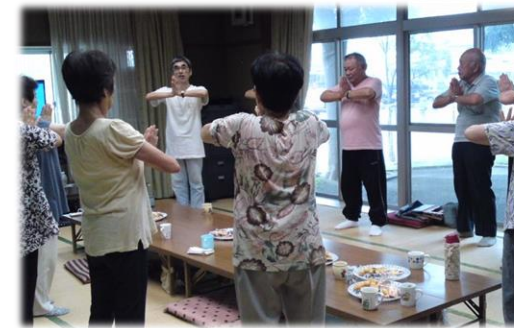
高齢者で集まり体操する様子(流山9丁目自治会) (地域支え合い活動推進事業)