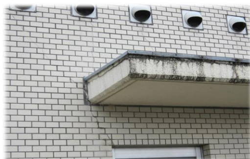
老朽化によりヒビが見られるタイル (保健センター施設整備事業)