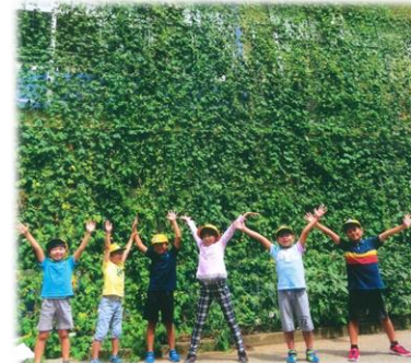
第10回緑のカーテン写真コンテスト小中学校部門 金賞 八木北小学校（緑のカーテン事業）