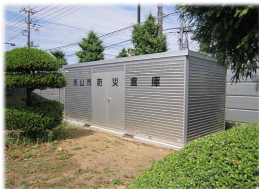
南部中学校に設置した防災備蓄倉庫 (防災備蓄倉庫設置事業)