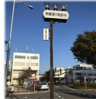
商店街街路灯 （商店街街路灯管理事業）