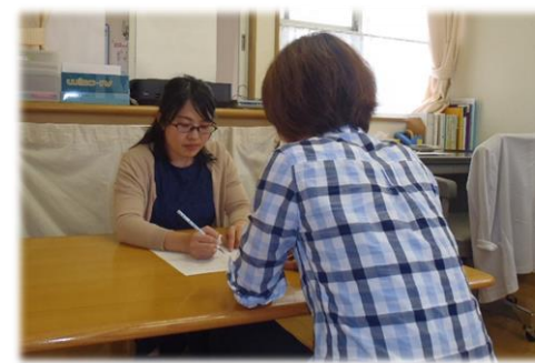
つばさ学園療育相談事業における療育相談の様子 (つばさ学園療育相談事業)