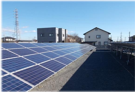
市有地活用の太陽光発電設備設置のイメージ （ファンリティマネジメント事業）