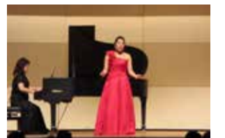
流山市音楽家協会・橋のコンサート風景