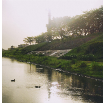
If you are nature person, this is one of the places you should visit in Nagareyama. When I went during summer, it was full of green and in autumn, the leaves were beautiful so it is a great spot to stroll. I want to stroll here every day!

自然が好きな人には、流山のお勧めのスポットの一つ。夏に行った時は、緑が多く、秋は紅葉が綺麗で、散歩をするにはとってもいいスポット。毎日ここで散歩したいくらい！