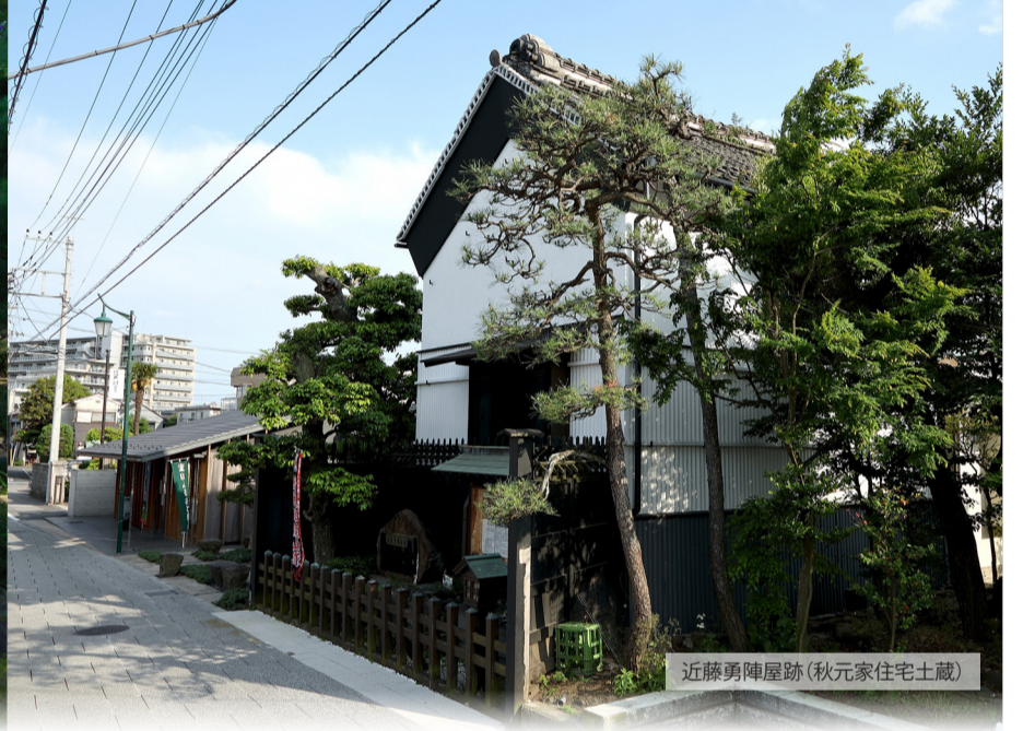
近藤勇陣屋跡(秋元家住宅土蔵)