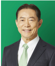
流山市長 井崎 義治

私が ご案内します! I'll be your guide! Let's have fun in Nagareyama!!