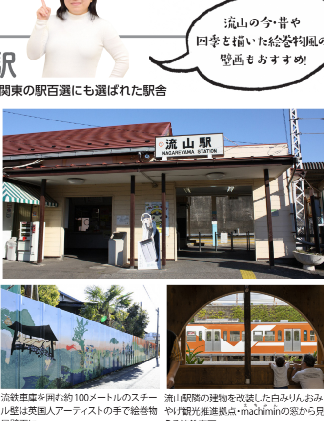
流鉄車庫を囲む約100メートルのステール壁は英国人アーティストの手で絵巻物風壁面に 流山駅跡の建物を改装した白みりんおみやげ観光推進拠点・machiminの窓から見える流鉄車両