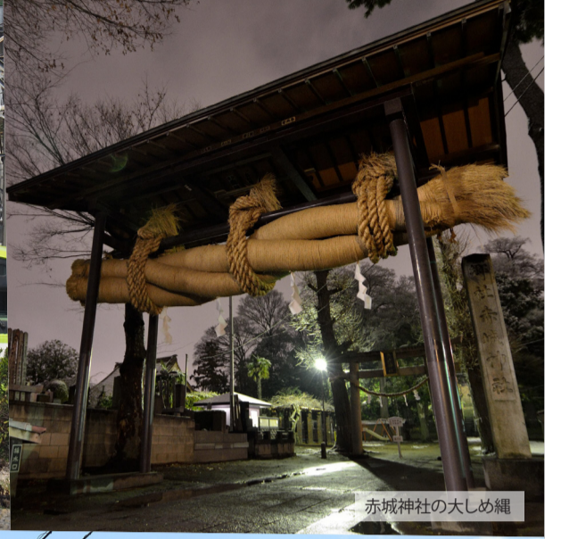
赤城神社の大しめ縄