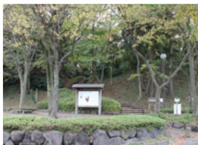
坂川と支流富士川合流点に築かれた前ヶ崎城跡

流山の歴史は、江戸川の流れと密接に関わってきました。江戸川とその支流である坂川の谷に囲われた鱈ヶ崎台には、前方後円墳である三本松古墳が築かれ、奈良・平安時代には拠点的な大集落が営まれました。中世の具体的な様子は、つくばエクスプレス建設に伴う発掘調査などによって、少しずつ明らかになってきています。思井堀ノ内遺跡は、鱈ヶ崎台の先端部に所在しています。平成10年(1998年)から6年間にわたって発掘調査が行われ、堀と掘立柱建物6棟から構成される居館跡などが見つかりました。墓からは成人女性の骨と歯が出土し、輸入された青磁碗・白磁皿や和鏡などが副葬されていました。坂川の谷奥部は、手賀沼へ注ぐ大堀川と非常に近い所に位置しています。手賀沼は利根川と霞ヶ浦を経て太平洋に通じており、坂川と江戸川が合流する地点は水上交通の要衝です。前ヶ崎城もまた、坂川を眼下に見おろす台地上に築かれていました。鱈ヶ崎台の周辺は、古代から中世には重要な地域であったと考えられています。