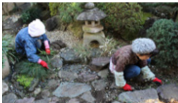
ちょい困サービスで利用の多い庭の除草作業