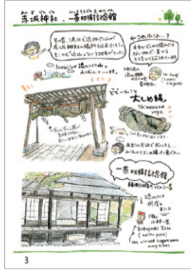
流山本町を紹介する冊子の一部

「イラストの活動を応援してくれた地域の皆さんや夫のサポートもあって続けてこられた活動が、受賞という形で実を結んだことが何よりもうれしいです」と今回の受賞を振り返る。今後も地域の課題や取り組みを漫画などで発信していくほか、原画展なども市内で開催していきたいと意気に燃える。