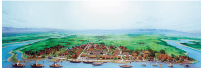
江戸時代の黒沢尻川岸(北上市立博物館の展示より)

1月11日(土)～3月15日(日)9時30分～17時(1月31日、月曜休館※祝日の場合は翌日) 博物館 無料