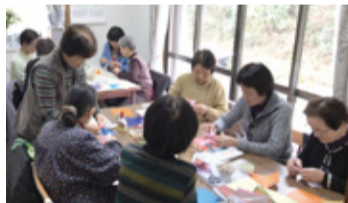
ちょい通サービスとして定期的に行われている折り紙教室