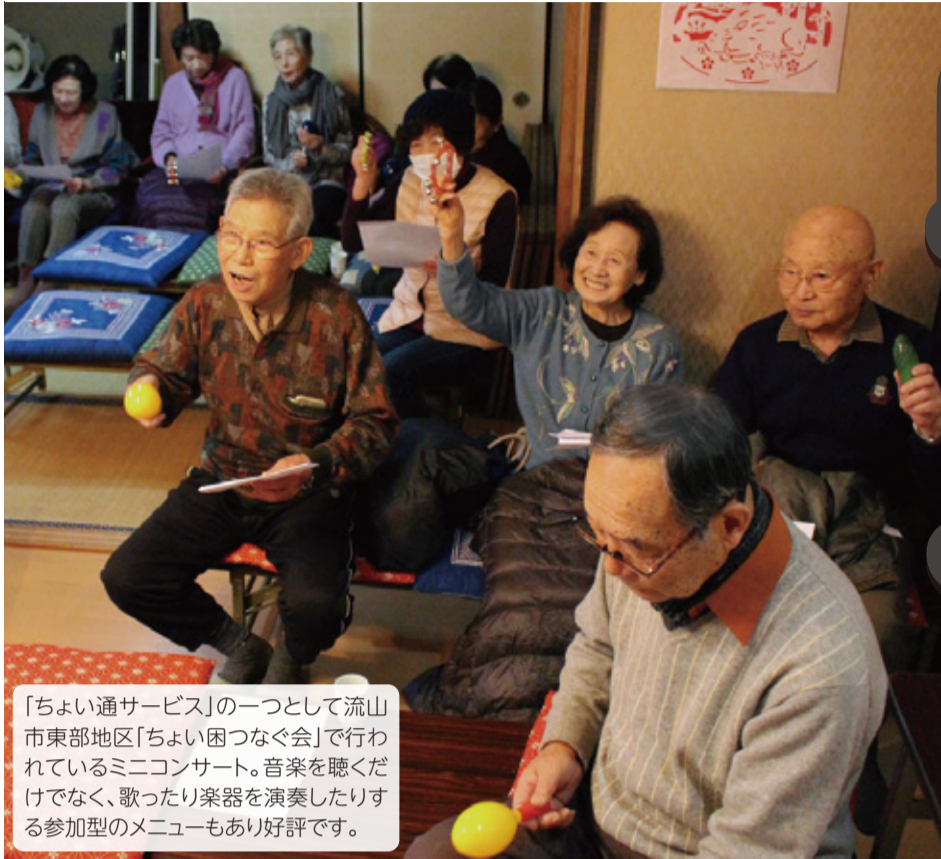
「ちょい通サービス」の一つとして流山市東部地区「ちょい困つなぐ会」で行われているミニコンサート。音楽を聴くだけでなく、歌ったり楽器を演奏したりする参加型のメニューもあり好評です。