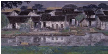
江南北水路の朝(1986年) 後藤純男美術館蔵