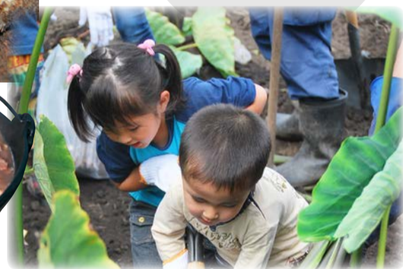
収穫体験イベントの様子