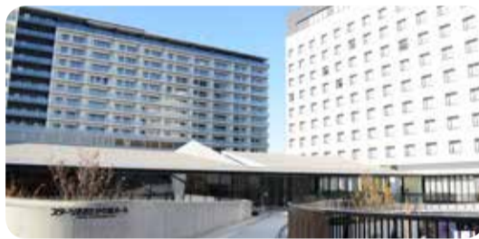
音響に優れたスタートおおたかの森ホールと本市初のシティホテル

流山おおたかの森駅北口駅前が新たな1つの「まち」となるように整備を進めてきた「North Square 63」には、多目的に利用でき音響に優れたスタートおおたかの森ホールや、出張所の機能を持つおおたかの森市民窓口センター、流山本町や利根運河の観光情報を提供する流山おおたかの森駅前観光情報センターからなる公共施設と、本市初のシティホテルなどが整備されました。市の新たな交流拠点は連日、多くの利用者で賑わっています。