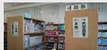
分かりやすい書架表示や配架(西初石中)