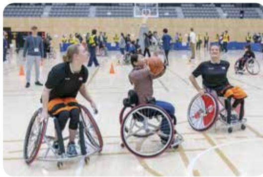
国際親善試合後に行われた車いすバスケット体験会

本市は、「東京2020オリンピック・パラリンピック競技大会」におけるオランダのホストタウンとして登録されています。2月には、女子車いすバスケットボールオランダ代表が事前キャンプを実施。選手たちは7日間にわたり、「国際親善女子車いすバスケットボール大阪大会」に向けた調整をキックオフアリーナなどで行いました。女子車いすバスケットボール日本代表との国際親善試合を約1,800人の方が観戦したほか、オランダ代表選手による車いすバスケット体験会などで、市民とオランダ代表選手が交流を深めました。また、市のホストタウンの取り組みとオランダを紹介するパネル展が開催されました。