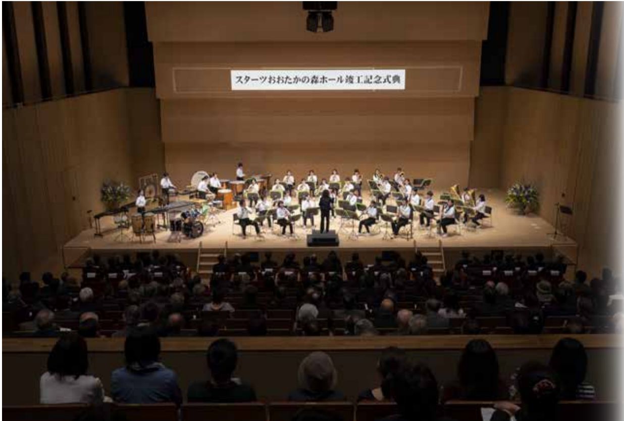
スタートおおたかの森ホール竣工記念式典で披露された北部中学校吹奏楽部による演奏

今年1年を振り返って 平成から令和へ 令和元年も残りわずかとなりました。今年には市民の皆さんにとって、どのような1年だったでしょうか。 4月にオープンした音響に優れたスタートおおたかの森ホールでは、著名なアーティストによるオーブニングコンサートや市民主催のさまざまなイベントのほか、市の魅力発信の一環としてドラマや映画のロケ地などにも活用されています。 市の人口は着実に増加し、年明けには19万5千人を超える見込みです。皆さんに「住んで良かった」と感じていただけるように、来年も安心・安全で快適に暮らせるまちづくりに取り組めます。 今号では、年の瀬に当たり話題になった出来事など、流山の今年1年を振り返ります。