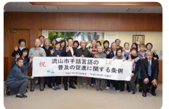
条例の制定を祝う流山市デフ協会の皆さん

流山市議会第1回定例会では、「流山市手話言語の普及の促進に関する条例」が全会一致で可決されました。9月には、条例制定を記念して流山市デフ協会主催による「流山手話フェスタ2019」が開催されました。引き続き、手話や聴覚障害者・ろう者に対する理解の促進を図り、障害の有無に関わらず、誰もが安心して生活できるまちづくりに市全体で取り組みます。