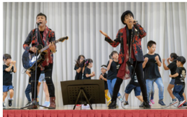
昨年の市民まつりではキッズダンスとコラボした

活動4年目に入り、さらに活動の幅を広げる二人。11月3日には、ユニットにとって連続3回目となる市民まつりステージの出演が決まっている。「初心を忘れずに、