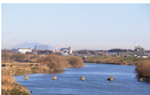
流山橋から見た旧流山橋と筑波山

丹後の渡しや加村の渡しは交通の要衝を結んだ渡しです。流山橋を架けるにあたり、昭和8年(1933年)に「江戸川架橋陳情書」が作成されました。ここには、「丹後渡船場は流山から埼玉県早稲田村を経て東京市に至る国道水戸街道の姉妹線として、その上流にある矢河原渡船場は流山から吉川を経て越谷に至る日光街道として利用される板栗の路線」と記されています。