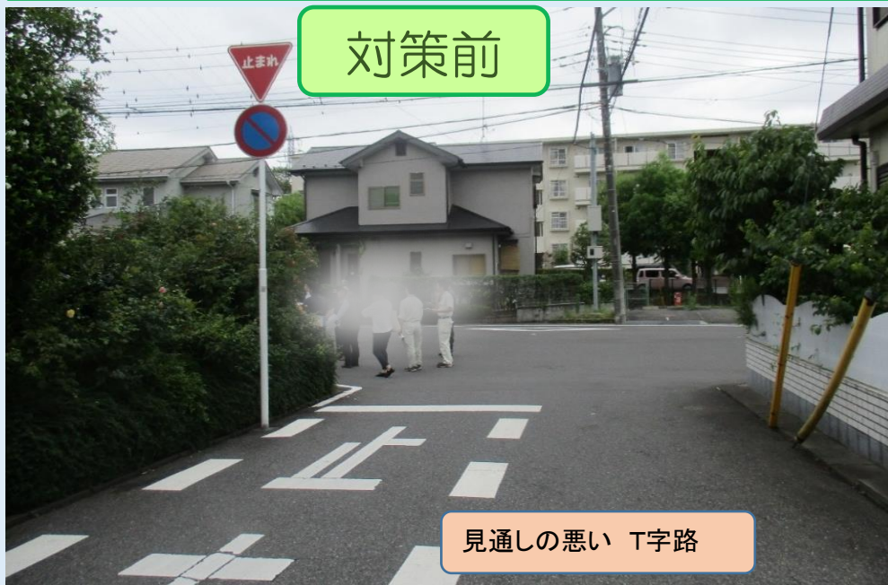
見通しの悪い T字路