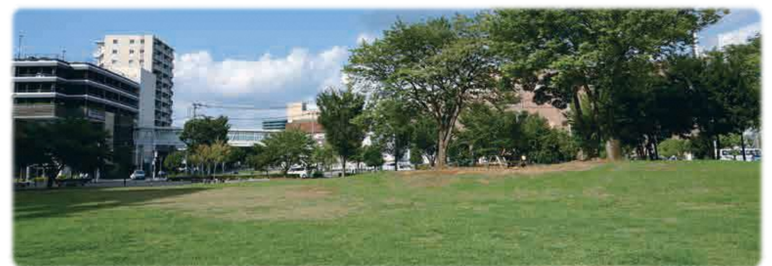
おおたかの森駅南口公園