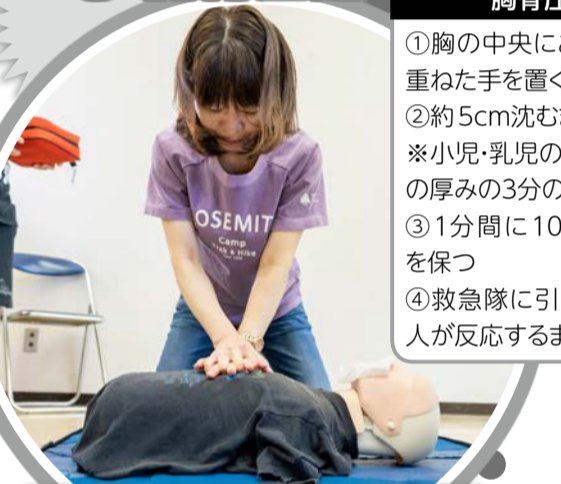
呼吸の有無を確認し、呼吸がない場合は胸骨圧迫を開始