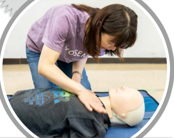
大きな声で呼び掛け、反応があるかを確認