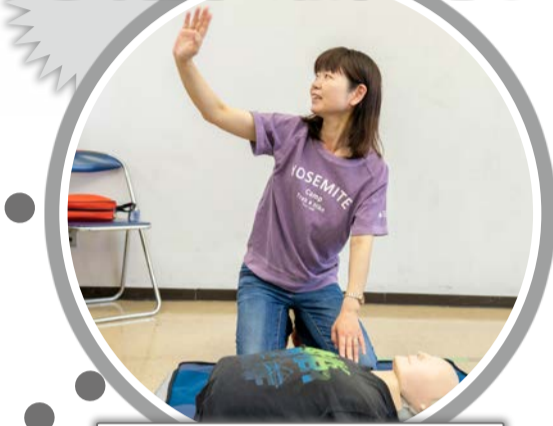
救急車やAED(自動体外式除細動器)の手配