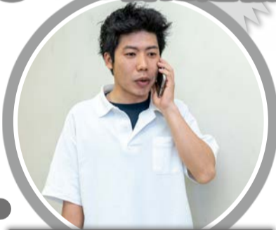
場所・傷病者の状況などを伝えます。通報すると指令員がその後の対応を説明します