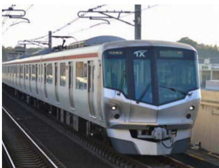
市内を走るつくばエクスプレス車両