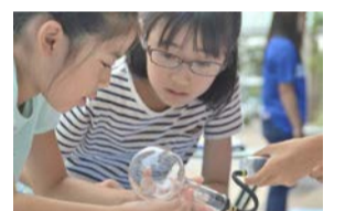
雲発生実験器具で雲の仕組みを観察