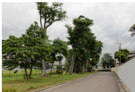
十太夫野馬除土手(立木左側が耕作地)

5月11日、流山おおたかの森駅周辺の字の区域と地名が変わります。近代的な街並みとなったおおたかの森地区を含む下総台地の北西部は、古くは葛飾野、江戸時代に入ってから小原と呼ばれていました。ここに徳川幕府は、良馬を育成するための小金牧という放牧場を設置します。