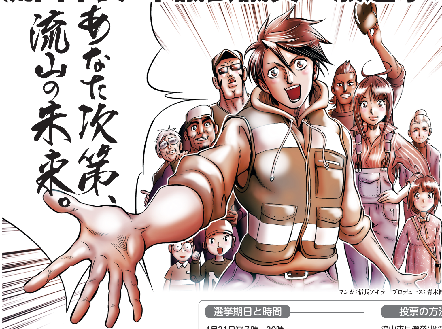
マンガ:信長アキラ プロデュース:青木健生

市長・市議会議員は、私たちの税金の使い方を決定する人たちです。誰を選ぶかで、流山のこれからは大きく変わります。あなたと流山の未来のために、あなたの一票を投票しましょう。