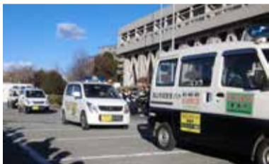
年末年始特別警戒で出動する流山市民安全パトロール隊

ボランティアの方々が制服を着用して活動する流山市民安全パトロール隊は、青色回転灯車両に乗って市内全域を巡回しています。防犯啓発を呼び掛けるアナウンスを流すほか、街頭啓発活動などによって犯罪発生を未然防止に取り組めます。