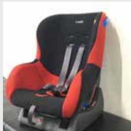
新生児から児童用まで貸し出し

認可外保育施設などに就園している乳幼児(国基準の待機児童)の保護者に対し保育料を助成します。平成30年10月から平成31年3月までの納入済みの認可外保育料分を一括して申請してください。詳細は、市ホームページをご覧ください。お問い合わせください。