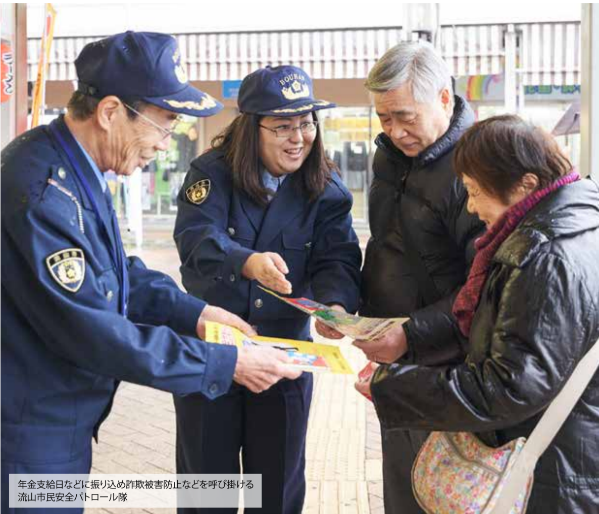
年金支給日などに振り込め詐欺被害防止などを呼び掛ける流山市民安全パトロール隊