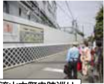
流山本町史跡巡り

NPO法人流山史跡ガイドの会の皆さんや子どもガイドによる流山本町界隈の史跡案内があります。