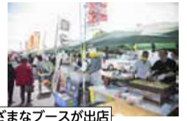
さまざまなブースが出店