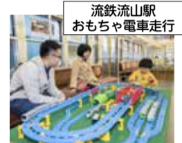
流鉄流山駅 おもちゃ電車走行