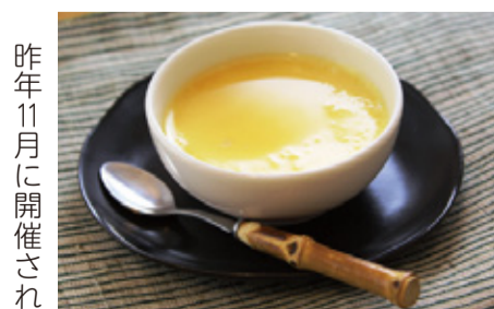
優しい甘さの「みりんプリン」(キッコーマンホームクッキングのホームページより)

一方で、最近では「みりんシロップ」を砂糖の代わりに使った洋風のスイーツが増えています。「みりんシロップ」は、みりんを加熱しアルコールを蒸発させ、半量近くまで濃縮するとできあがります。みりんは米と米麹を使って醸造し、その過程で米の甘みとうま味が引き出されますが、この味をいをデザートや菓子用として活用したのがみりんシロップです。砂糖にはない優しい甘さと、米から生まれる自然な風味と香りがあり、スイーツを甘すぎず自然な味に仕上げたい時に活躍します。