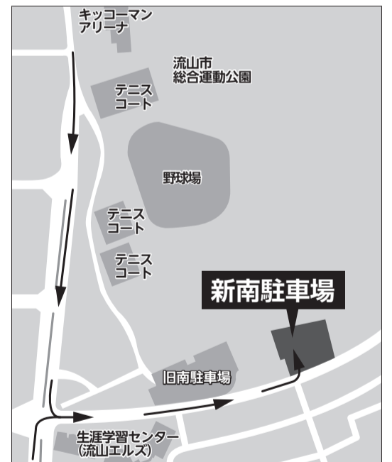
問みどりの課 ☎7150-6092 ID 1010052

市総合運動公園新南駐車場の完成に伴い、1月22日をもって旧南駐車場が廃止となります。23日からは、新南駐車場(一別図)のご利用をお願いします。