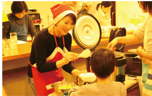
子ども食堂でのボランティア活動(昨年12月)

今春、祖父母や両親、息子のエピソードに加え、子ども食堂での実践などを交えた、「7袋のポテトチップス—食べるを語る胃袋の戦後史—」(晶文社)の上梓を予定している。「栄養や食欲を満たすだけでなく、誰かと共に食の時間を過ごすことが、