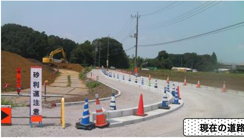
現在の道路整備の様子

新設小学校と新設中学校の間の道路を工事し、車道幅6m、歩道幅3mで整備しています。