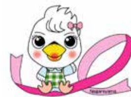
流山市けんしんPRキャラクター「ウケタカナちゃん」

マンモグラフィ検査(集団検診)は11月30日から実施します。 申電子申請または任意の用紙に「乳がん検診」、住所、氏名(フリガナ)、生年月日、性別(女性)、電話番号を明記の上、☎270-0101 流山市西初石4-1-433-1 保健センターに郵送または直接窓口に電話にて受付ください。 問保健センター ☎7154-0331 ID1000674