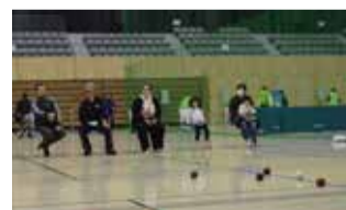
昨年行われたボッチャ体験

市では、どなたでも気軽にスポーツを楽しむことができるようにユニバーサルスポーツの普及を進めています。 今年はパラリンピック公式種目・ボッチャなどのユニバーサルスポーツ体験や、各種世界大会で活躍する高校生チーム「Steel」・ギネス記録を有する「DIANA」の皆さんによるダブルダッチ講習会を開催します。 日10月20日(土)9時30分～15時30分 所キックマン アリーナ 対①ユニバーサルスポーツ体験(9時30分～12時30分)②ダブルダッチ講習会(13時～15時30分) 対②のみ4歳以上の方 定②のみ100人(先着順) 費無料 持室内用シューズ、飲み物、タオル 申②のみ市役所スポーツ振興課に電話またはメール 問スポーツ振興課 ☎7157-2225 問sports@city.nagareyama.chiba.jp