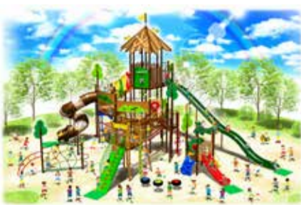
大型複合遊具のイメージ図

市総合運動公園をより楽しく遊ぶことのできる空間にするため、皆さんからのご寄附をお待ちしています。手続きなど詳細は、市ホームページ