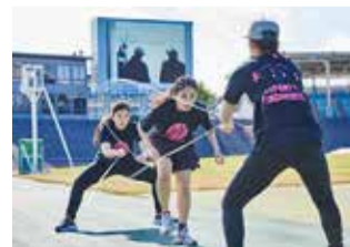
ダブルダッチチーム「DIANA」