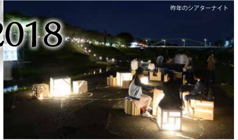
昨年のシアターナイト