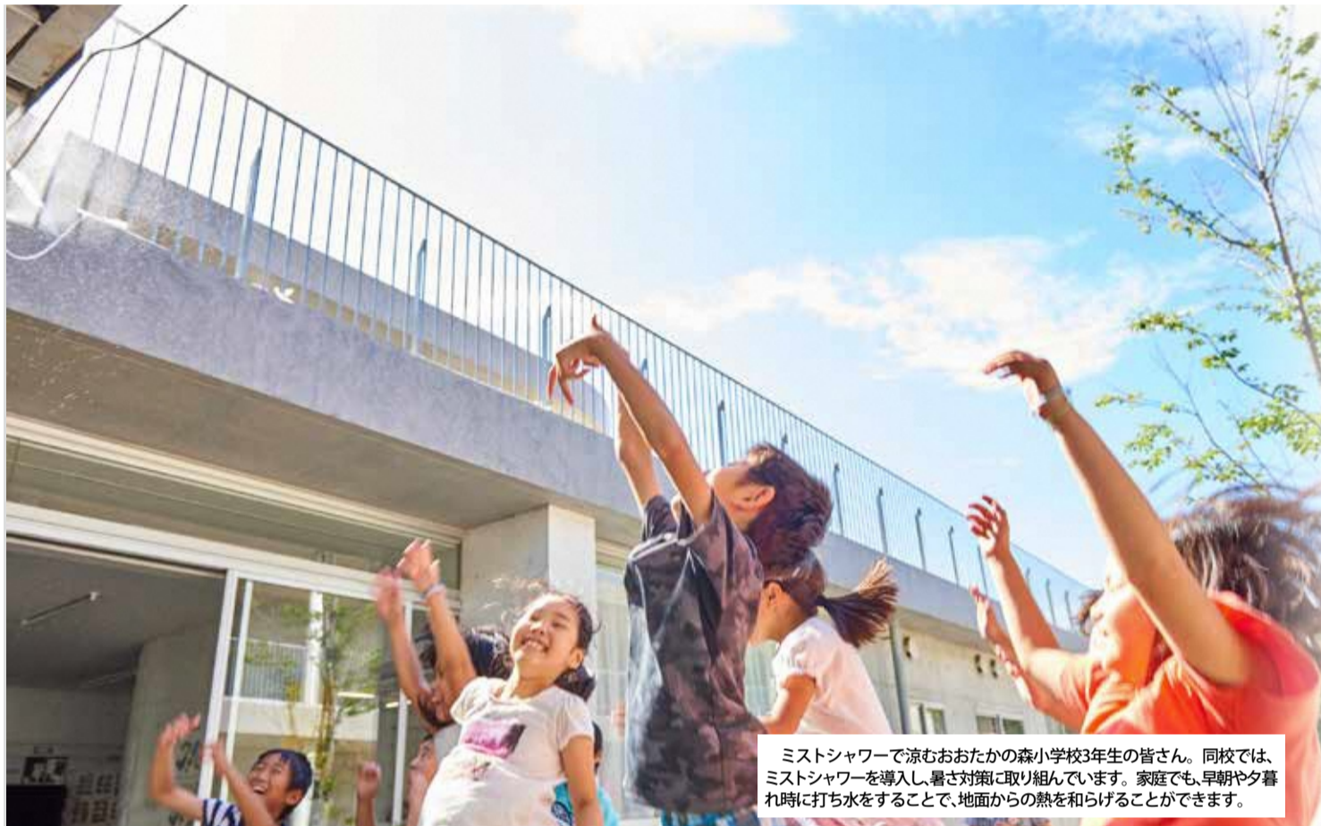
ミストシャワーで涼むおたかの森小学校3年生の皆さん。同校では、ミストシャワーを導入し、暑さ対策に取り組んでいます。家庭でも、早朝や夕暮れ時に打ち水をすることで、地面からの熱を和らげることができます。

気温と湿度が高くなる夏は、体内の水分や塩分のバランスが崩れやすい季節でもあります。大量の汗をかくことで立ちくらみやめまいを起こす熱中症だけでなく、暑さによる疲労で食欲不振などの症状を引き起こす夏バテにも注意が必要です。