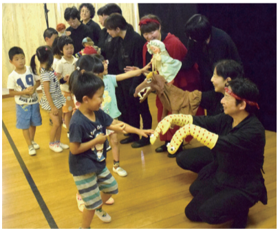
公演後、人形などを手に子どもたちとふれあいのひととき

7月20日には中央図書館で開催される「人形劇のつどい」に出演する(3面参照)。「子どもたちはもちろん、大人にもぜひ見て欲しい」と、会場で出会える笑顔を楽しみに練習に励む。