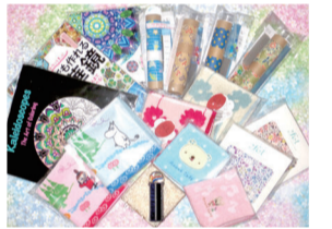
お楽しみくじ賞品の一例