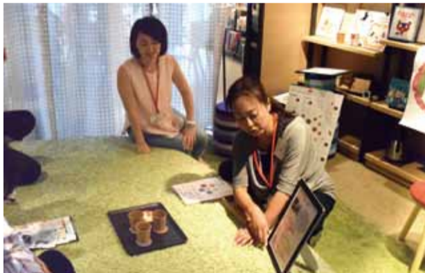
消しゴムはんこや子ども服などの制作、ガーデニングコーディネーター、心身のセルフケア講座など、さまざまな分野で活躍する市の創業スクールの卒業生

女性を取り巻く労働環境が変化している中、育児や介護との両立など、それぞれのライフスタイルに合わせた多様な働き方への関心が高まっています。市では、流山で創業を目指す女性を対象に「創業スクール」を開催し、スキルの習得やネットワーキングなどを支援しています。同スクールが開校した平成27年度から29年度までの3年間で69人が卒業し、地域で活躍しています。 今号では、流山を拠点として、市内外に活動の場を広げている同スクールの卒業生を紹介します。流山発の創業スタイルに、あなたも挑戦してみませんか。 問 商工振興課 ☎715016085 ID 1017884