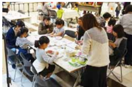
去年12月に開催されたワークショップ

5月5日・6日には流山おおたかの森S・Cで「ミートアップスペースmikke! ワークショップ」を開催します。ハーバリウム作り、エアーフレッシュナー作りなど、各日5種類のワークショップを体験することができます。母の日の贈り物にも最適な内容となっていますので、ぜひ足をお運びください。