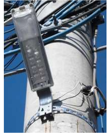
防犯灯（電柱共架型）

平成27年度までは自治会で設置及び維持管理をしていただいていたが、平成28年4月からは市が防犯灯の設置・移設・撤去(以下「設置等」という。)及び維持管理を行っています。