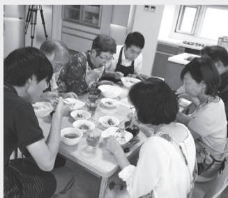
市民活動団体が企画する、1人暮らしのシニアなどが集まる食事会「いっしょに朝ごはん会」