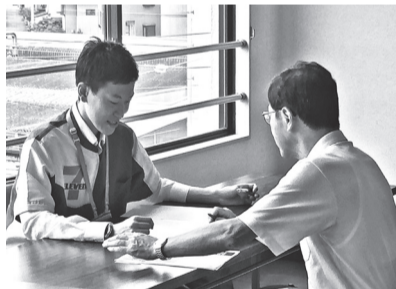
8月に行われた「シニア従業員のためのお仕事説明会」

対 市内在住で60歳以上の健康な方 関 流山市シルバー人材センター ☎7155-3669