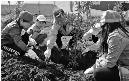
昨年は十太夫近隣公園に苗木を植樹

一般社団法人千葉県トラック協会の協力により、小山小学校4年生の児童や関係者約150人が参加し、214本の苗木の植樹を行う予定です。