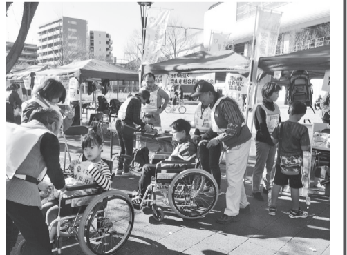
昨年12月の流山おおたかの森防災フェアで行われた、「もみじの会」による車椅子体験コーナー