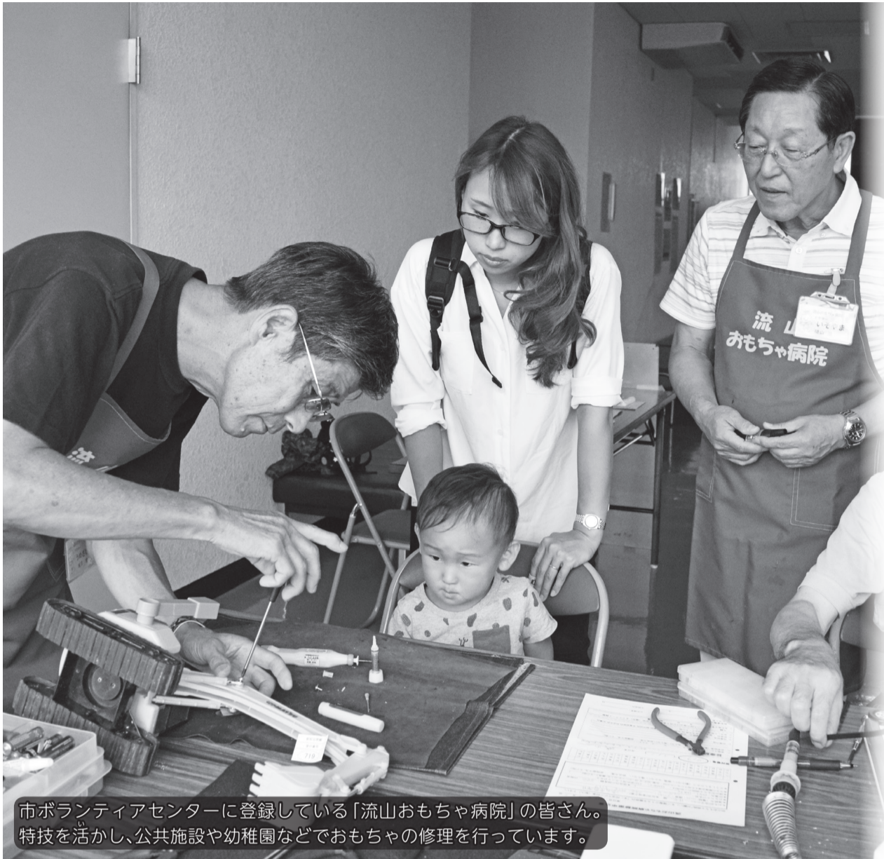
市ボランティアセンターに登録している「流山おもちゃ病院」の皆さん。特技を活かし、公共施設や幼稚園などでおもちゃの修理を行っています。