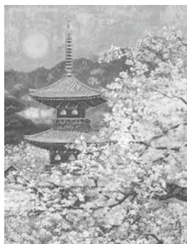
盛春塔映