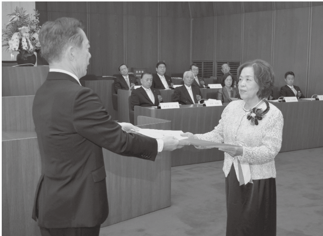
受賞者一人ひとりに井崎市長から表彰状が手渡されました