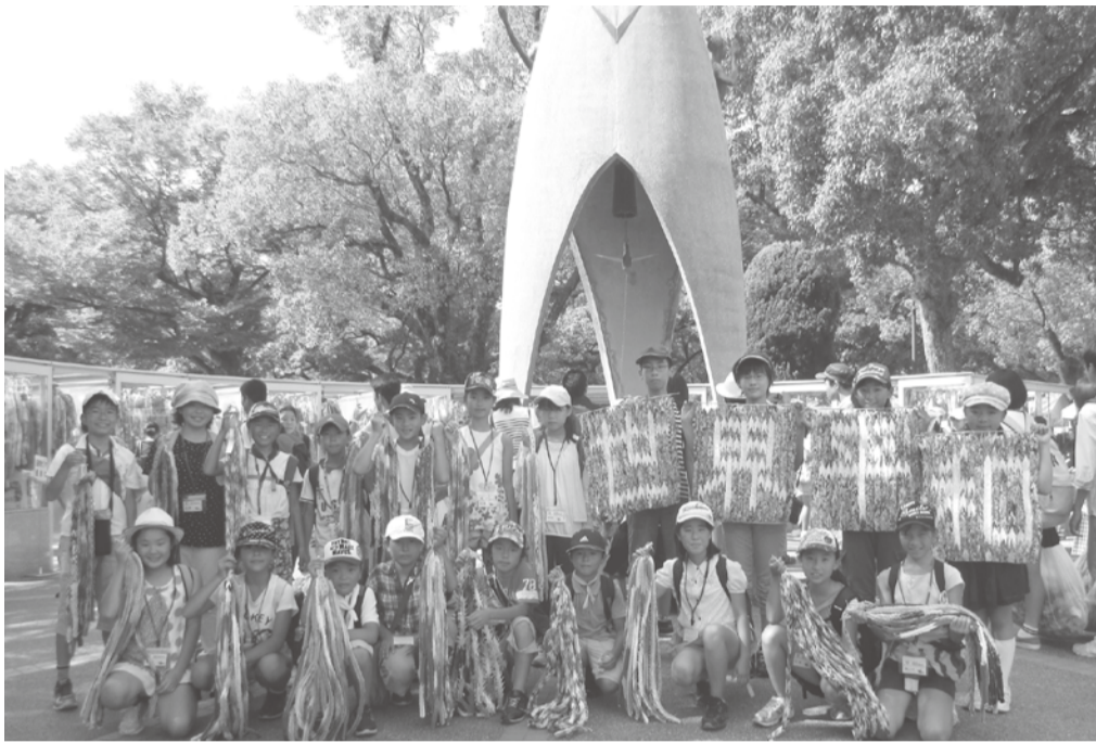
昨年、約23万8千羽の折り鶴を平和記念公園に献納した平和大使