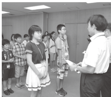
昨年の報告会の様子