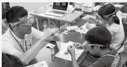
昨年の同イベントの「水のぶんせき体験」