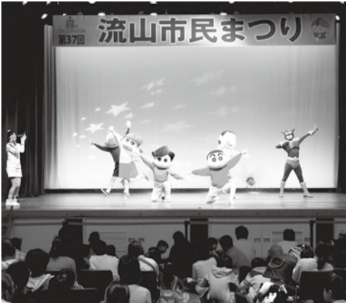
昨年のステージイベントの様子