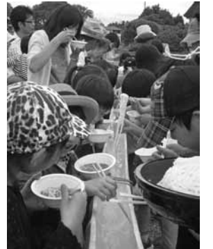
毎年好評の流しそうめん