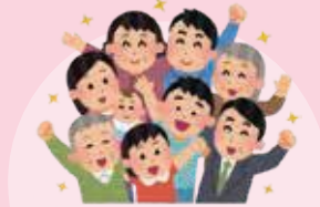
ちいき ひと 地域の人