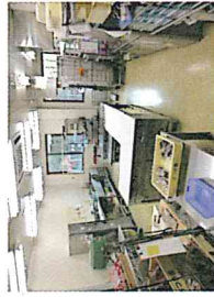
パン・焼き菓子作業室