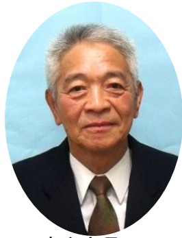
高市会長 公選 駒木