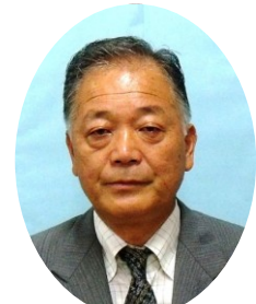
大作榮委員 公選 小屋