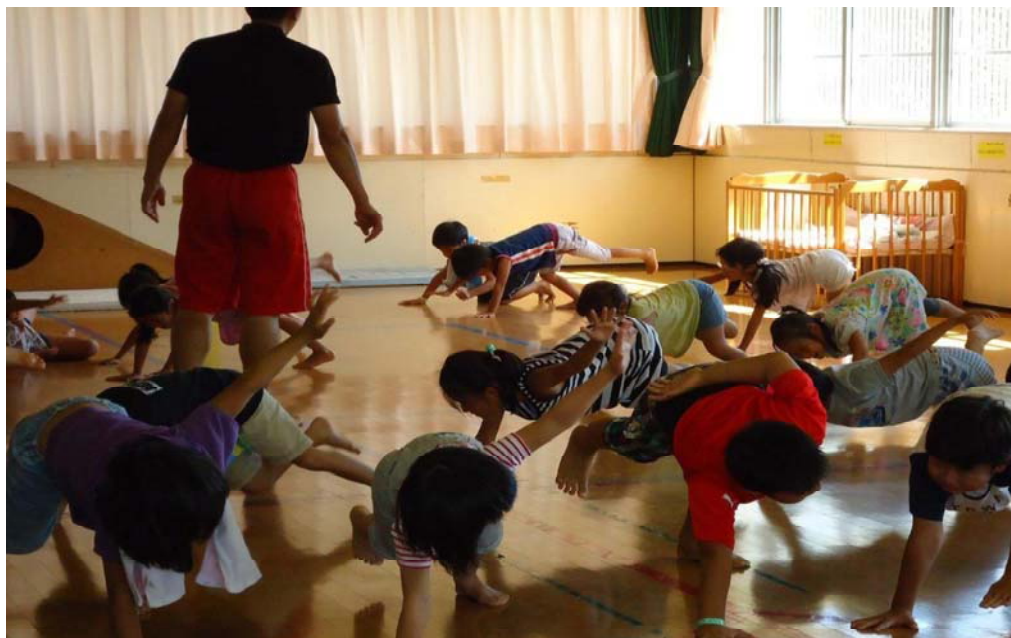
野々下児童センターを利用する子ども達