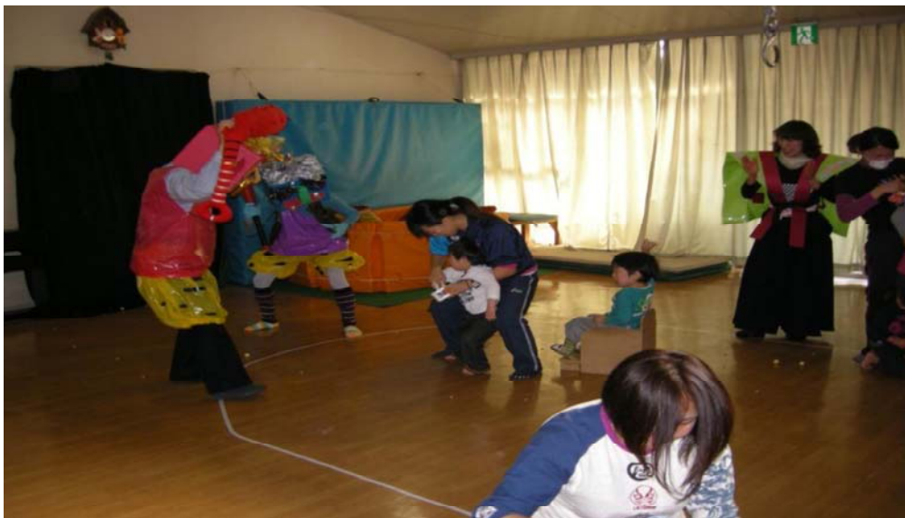
「デイサービスつばさ」の節分会豆まきの様子