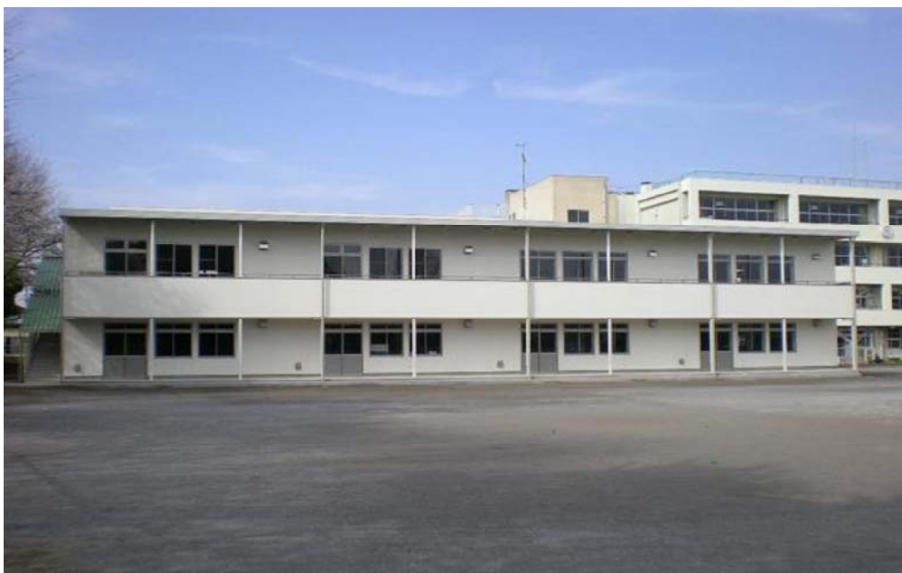
増設したもりのいえ第2・第3学童クラブ（東深井小学校2階2教室分）