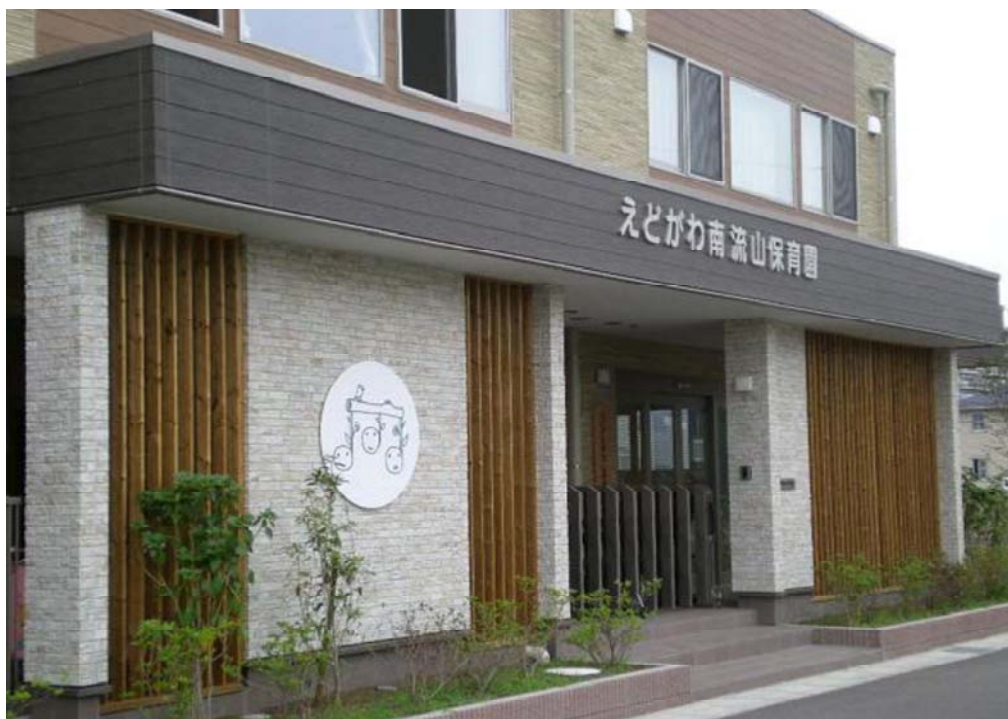
木地区に新設されたえどがわ南流山保育園