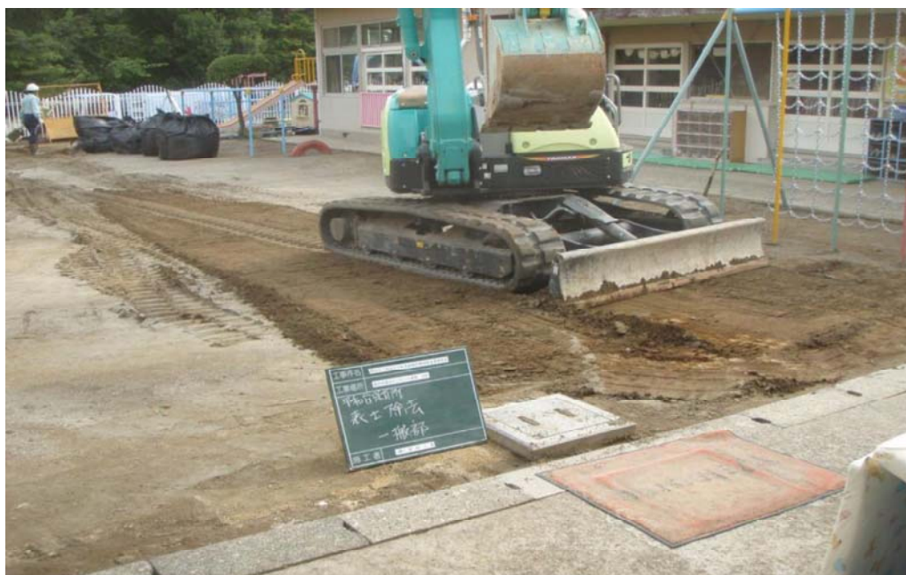
平和台保育所の除染作業