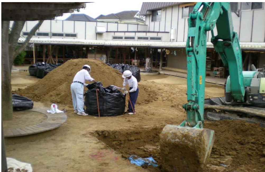
生活クラブ風の村わらしこ保育園流山の除染作業