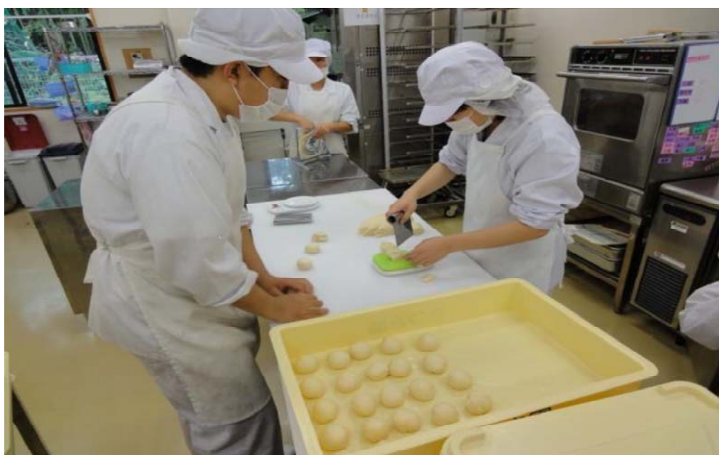
パンやお菓子を作っている「さつき園」の様子