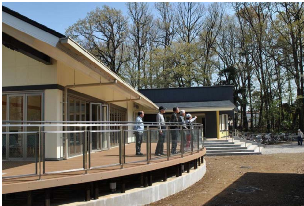
平成24年度に工事完了した老人福祉センター本館