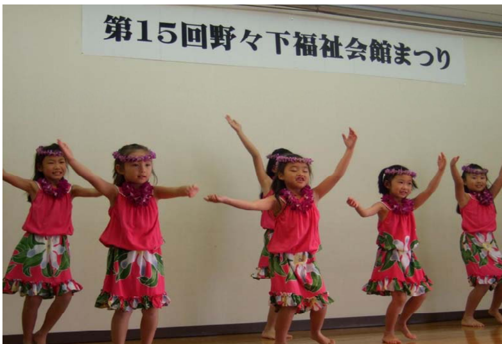
野々下福祉会館まつり