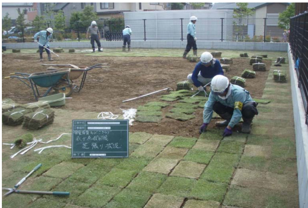
ちびっこクラブの除染作業