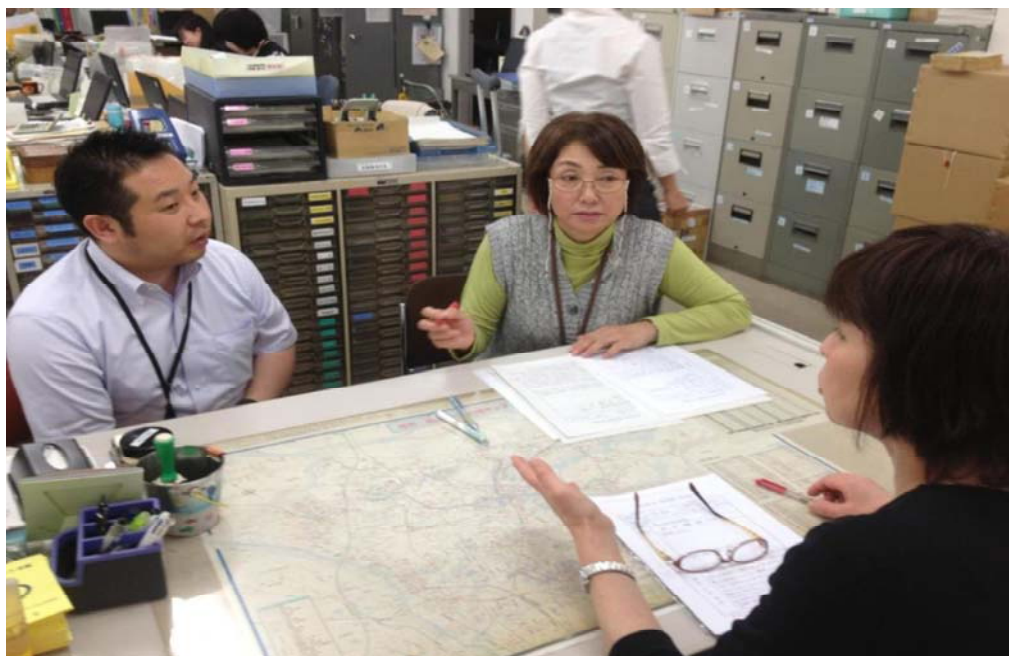
手話通訳をまじえた相談窓口の様子