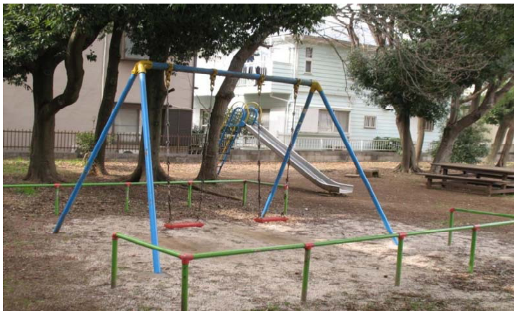
除染を実施した子どもの遊び場