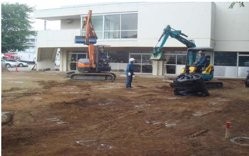
福祉会館除染作業