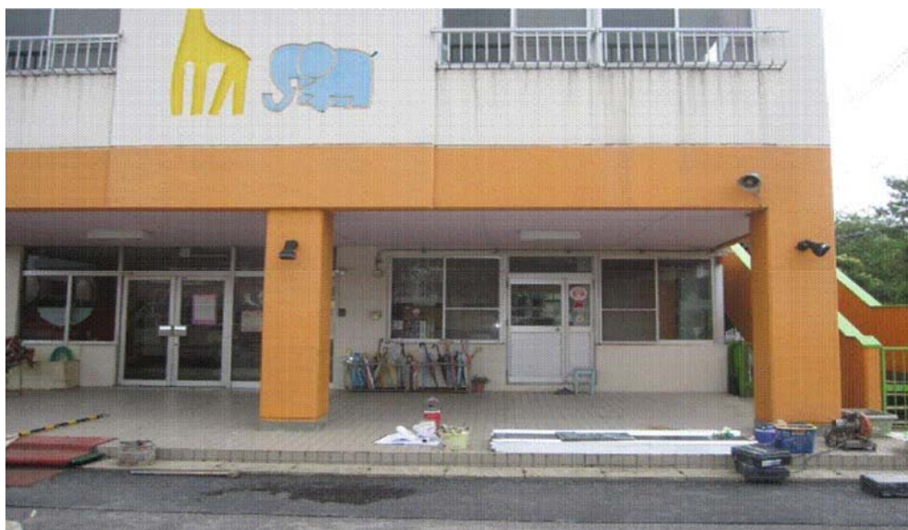
平和台保育所耐震改修工事