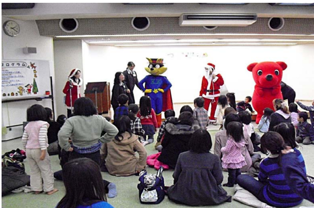
クリスマス スペシャルお話し会