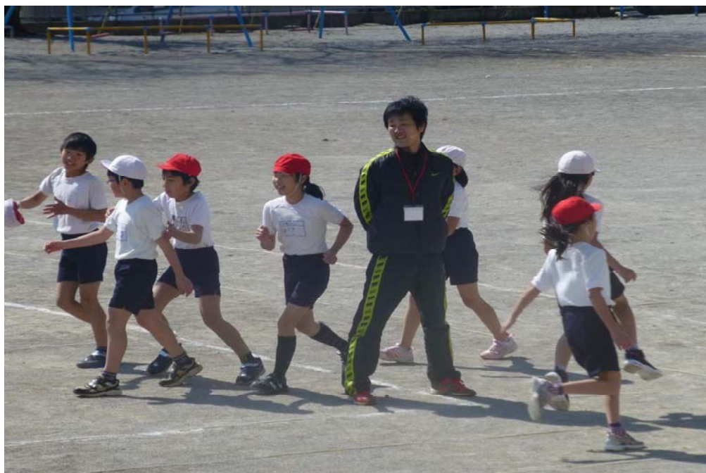
学習サポート教員による授業風景