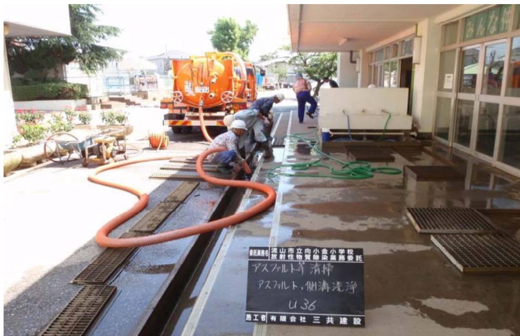
向小金小学校の除染風景