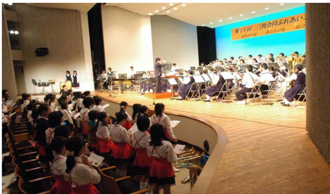
文化会館の利用風景