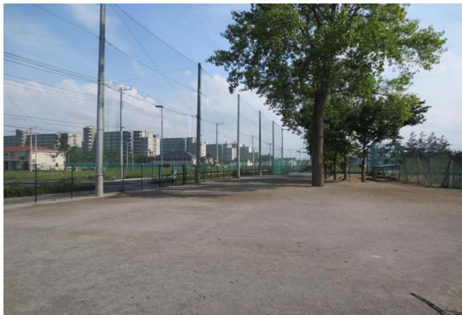
購入した南流山中学校用地