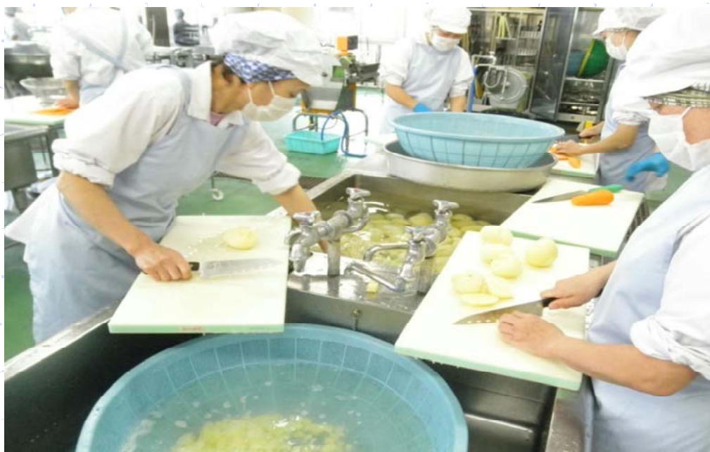
学校給食の民間委託