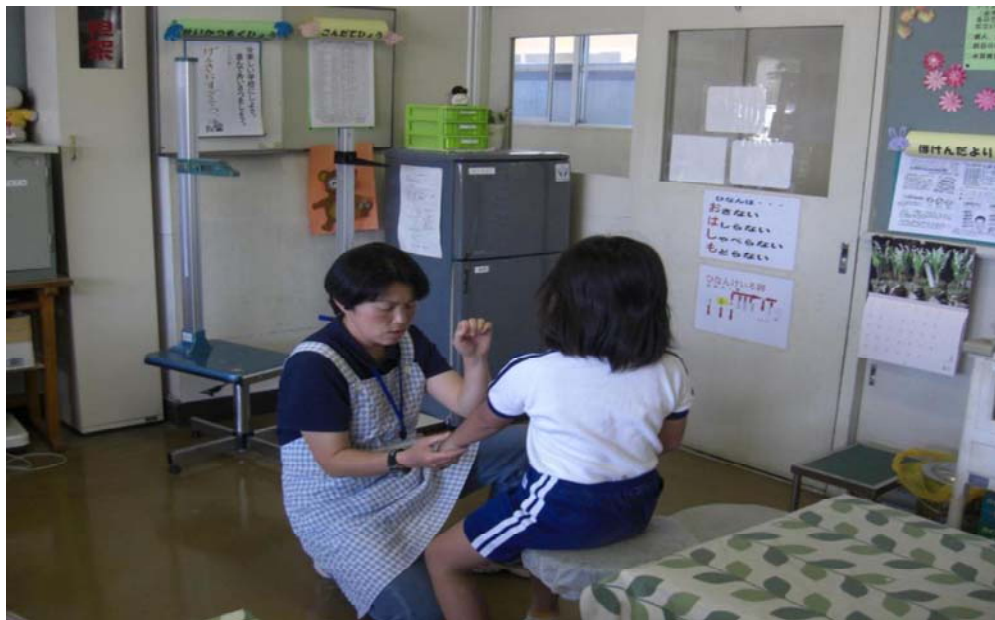
学校サポート看護師の健康チェック