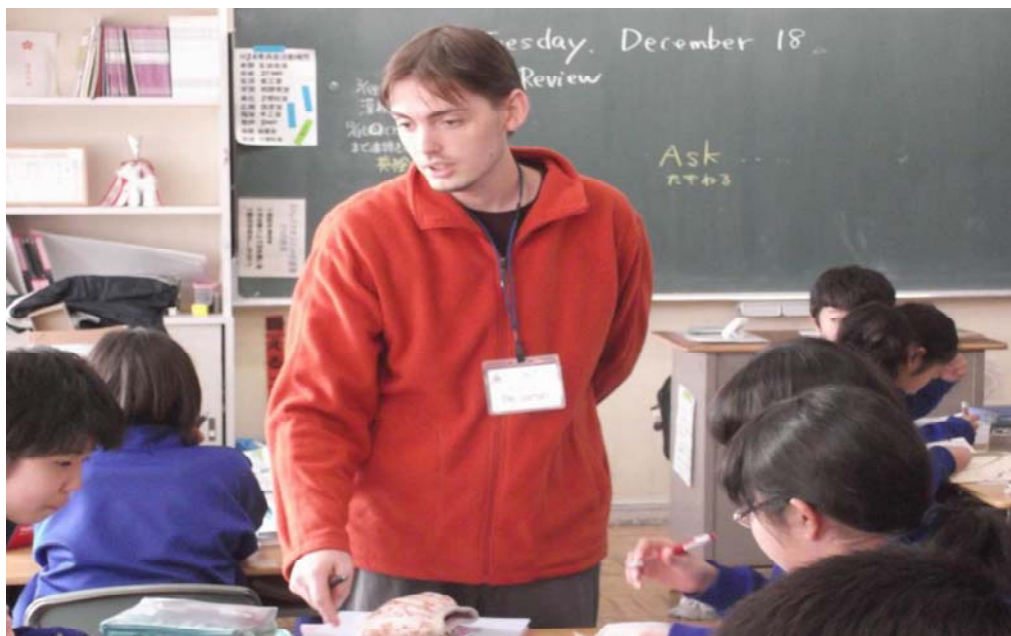
ALT(assistant language teacher)の授業風景