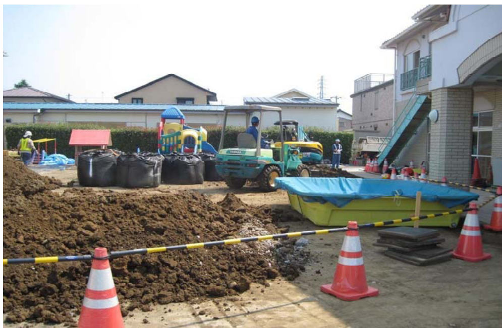
みやその幼稚園の除染作業