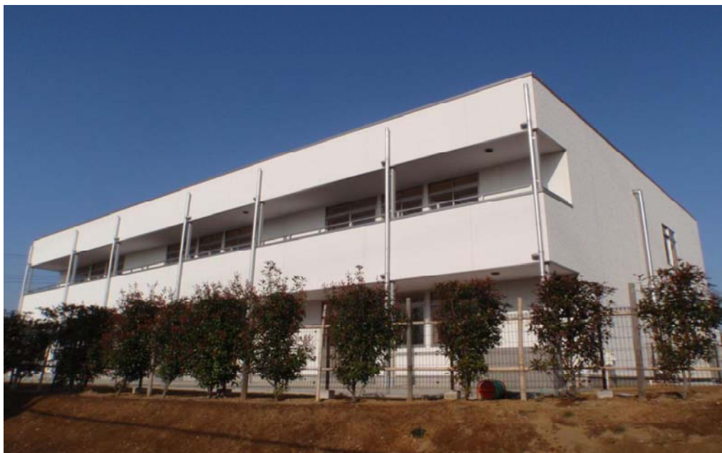
小山小学校増築校舎外観図