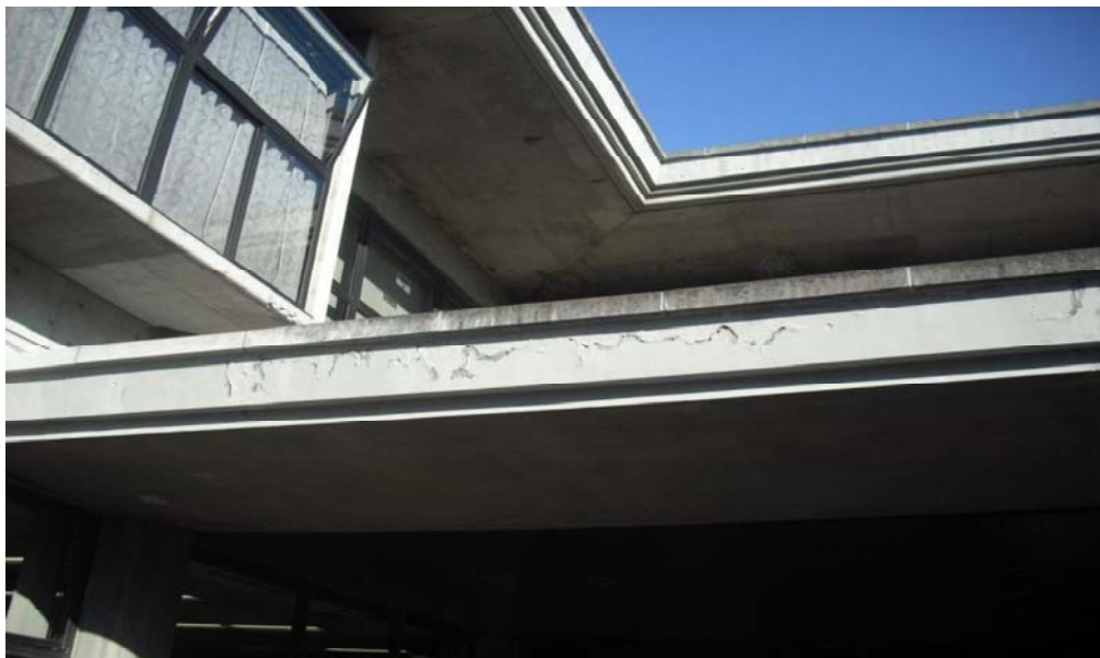
中央図書・博物館入口に発生した亀裂