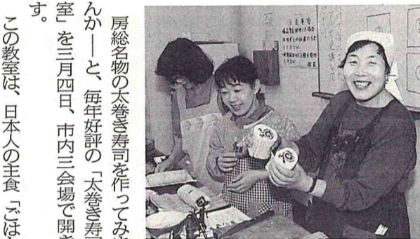
きれいな太巻き寿司が簡単に