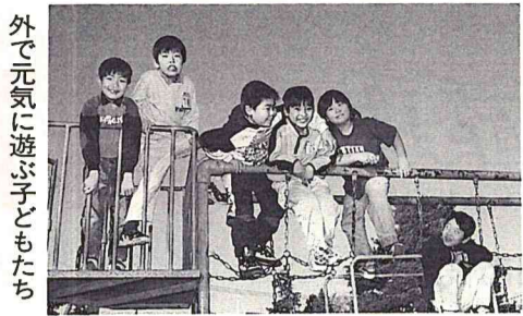
外で元気に遊ぶ子どもたち