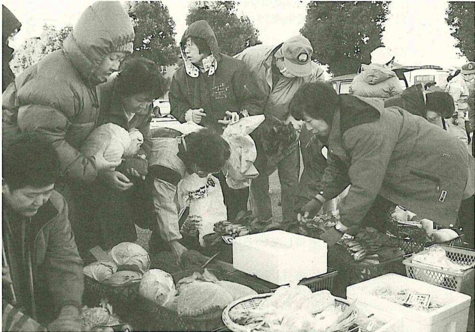
あっという間に売り切れてしまうことも...

⑤ストレスをためない ⑥室内を乾燥させない⑦マ スクを着用する 特に抵抗力の弱い高齢者 や子どもはかぜが長引く と、肺炎など重い症状にな るので早めに医師の診察を 受けましょう。 3 1 国健康管理課 ☎54-003