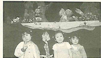
人形劇の楽しい世界へ……

第二回東生涯大陶芸作品展(東生涯大 江戸川台校主催) ▽日時 1月21日(木)～24日