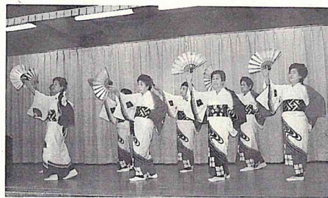
歌や踊りの発表も

だれでも自由に入場できますので、ぜひご来館ください。 ▽日時 1月30日(土)10時30分～15時 ▽場所 十太夫福社会館 内容 午前：介護保険についての講演会、午後：歌や踊りなどの発表 表 ④ 十太夫福社会館 ☎54-5255