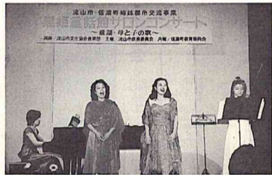
信濃町の皆さんと大合唱

市役所市民ギャラリーで毎月末の金曜日に開催され、市民の皆さんに好評の「サロンコンサート」。 このサロンコンサートが八月二十一日、姉妹都市交流事業の一環として長野県信濃町