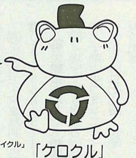
市「ごみ減量とリサイクル」キャラクター 「ケロクル」

「家庭ごみの正しい分け方・出し方」および「粗大ごみの出し方」を掲載したパンフレットを、現在、行政連絡員を通じて全戸に配布しています。5種分別収集への移行に伴い、収集日も変わりますので、パンフレットの裏面を確認の上、新しい収集日を記入して、台所の壁に張るなどしてご活用ください。