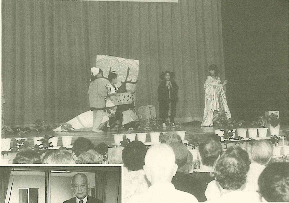
小学生の一生懸命な演劇に会場の皆さんも思わずにっこり