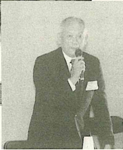
眉山市長もパネラーとして参加②

活動の成果をまとめた「市民版地域別検討集」の内容を、四地域のそれぞれのメンバーが発表しました。「人と自然にやさしく、心豊かに暮らせるまちづくり」を二十年後の姿とした北部地域は、ふれあいのある商店街や電子メールなどを活用した商店の活性化、バリアフリーの道路、運河・斜面林の保全など、空き教室を利用して陶芸教室などを行う、地域に開かれた学校などを発表。