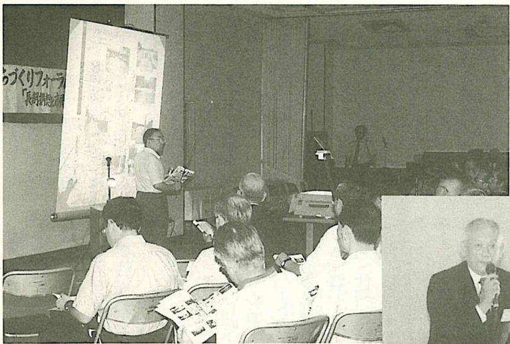
地域の未来像を発表するワークショップのメンバー①

ワークショップのメンバーは、広報などで募集した市民などからなる約百五十人。メンバーは北部、中部、南部、東部の四地域のグループに分かれ、この五月から自分たちが住んでいる身近な場所の特徴や特性などを、タウンウォッチングなどを行いながら、活動してきました。今回の「第八回地域別ワークショップ」全体会では、