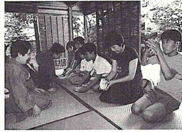
「いい器ですねえ」と観賞

五日まで、親子茶道教室が開かれました。双樹亭の奥の間に開かれた教室には、三日間で十七組四十三人の親子が参加。枯山水の庭園を眺めながら、風流なひとときを過ごしました。