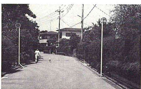
緑豊かなまちなみは心も和みます

【補助の限度額】 ①生け垣の設置補助 1m当たり1万円(限度額は5万円)を限度に工事費の一部を補助 ※自力で設置した場合は樹木の購入費のみ対象 ②既存塀の取壊しの補助 1m当たり1万円(限度額は5万円)を限度に工事費の一部を補助 ※業者に依頼した場合のみ対象 園公園緑地課 ☎50-60092