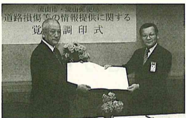
協定書を交わす眉山市長と宇佐美郵便局長

選挙人名簿登録者数 公職選挙法に基づき六月一日現在の選挙人名簿登録者数は、十一万五千七百八十八人(前年比二千六十七人増)。男女別では、男性が五万七千五百九人、女性が五万八千二百七十九人です。この登録者数の発表は、正確な有権者数を把握するため、年四回行っています。 選挙管理委員会事務局 ☎50-6100