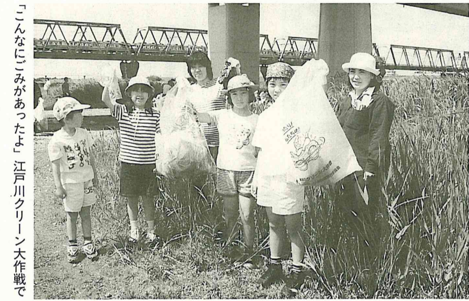
「こんなにごみがあったよ」江戸川クリーン大作戦で