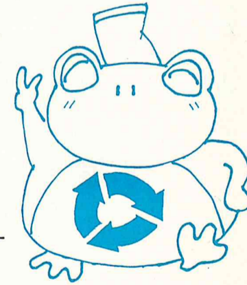
市「ごみ減量とリサイクル」キャラクター「ケロクル」