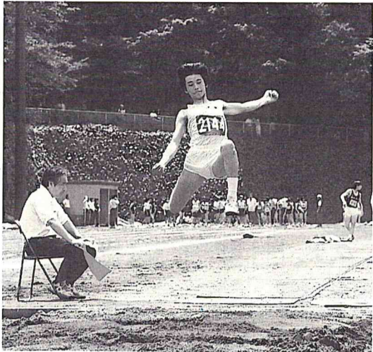
中学校男子 走り幅跳び