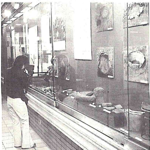
多くの出土品を市民ギャラリーに展示中

昭和五十九年から平成八年までの発掘調査で見つかった、縄文時代中期(約五千年~四千年前)の遺跡「中野久木谷頭(たにがしら)遺跡」の出土品を市役所市民ギャラリーにて展示しています。 この遺跡は、東武野田線江戸川台駅から南西約六百メートルに位置し、竪穴住居跡二百七軒、土坑(ごう)千九 十二基などが発見されました。住居は田を描くように環状に並び、数多くの土器や石器も出土し、その規模は県内でも屈指のものといえます。クジラの脊椎やヒスイの装飾品なども展示されています。 ▽期間 2月28日(月)まで 場所 市役所市民ギャラリー ☎社会教育課 ☎50-610