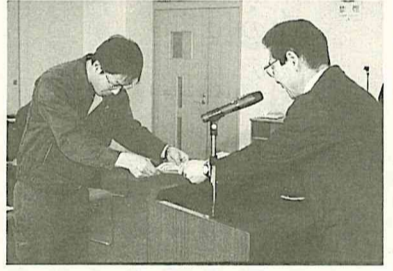
達成証と副賞を受け取る「経済センター」チーム

交通安全の意識を高め、交通事故の防止を図るつと、昨年八月四日から十二月三十一日までの百五十日間で行われた「流山市セーフティドライブ・チャレンジ150」(150日間無事故・無違反運動)の表彰式が今日二日にケアセンターで行われました。 参加したのは、市内の事業所の仲間など千七十八(二六六チーム)。そのうち無事故・無違反だったのは千九十九(二七〇チーム)で、達成率は九十五パーセントでした。無事故・無違反を達成したチームには「達成証」が贈られ、当日は、抽選で五チームに「相馬ユートピアの宿泊券」が贈られました。