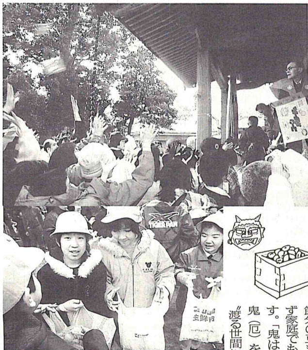
集まった多くの人々に上下をつけた年男たちが盛大に豆まき① たくさんのお菓子を受け取ってご満悦の子どもたち②

「鬼を追い払っていい春が迎えらるるよ」と立春前日の二月三日、節分行事が市内神社などで行われました。さつき園生やつばき学園、西初石小学校(二年生)の子どもたちは、上宿の金刀比羅(ごごひら)神社で写真で行われた節分行事に招かれ、元気に豆まきに参加しました。当日は厳しい寒さにもかかわらず、招待された子どもたちや近所の人たちなど約三百人もの人出。境内を取り囲むほど集まりました。