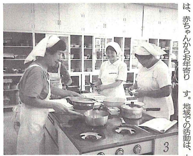
健康な食生活を身につけてもらうため、地区栄養講座などを開催

四月から活動する新しい保健推進員を募集します。保健推進員の主な活動は、赤ちゃんからお年寄りまでの健康づくりの推進などです。地域での活動は、小学校区(ごと)に行きます。任期は平成十五年三月までの三年間です。なお、保健推進員は、四月から名称が「健康づくり推進員」に変わる予定です。 ▽募集小学校区(募集人数) ①流山小(3人) ②八木北小(2人) ③新川小(2人) ④江戸川台小(1人) ⑤東深井小(1人) ⑥西初石小(2人) ⑦長崎小(3人) ⑧流山北小(1人) ⑨西深井小(1人) ⑩南流山小(4人) ⑪対象 健康づくりに熱意と関心があり、各小学校区内に住んでいる60歳以上の健康な方 ▽任期 3年間(平成12年4月1日～平成15年3月31日) 申し込み方法 2月29日までに電話で保健センターに連絡後、応募用紙を提出 園保健センター 54-0331