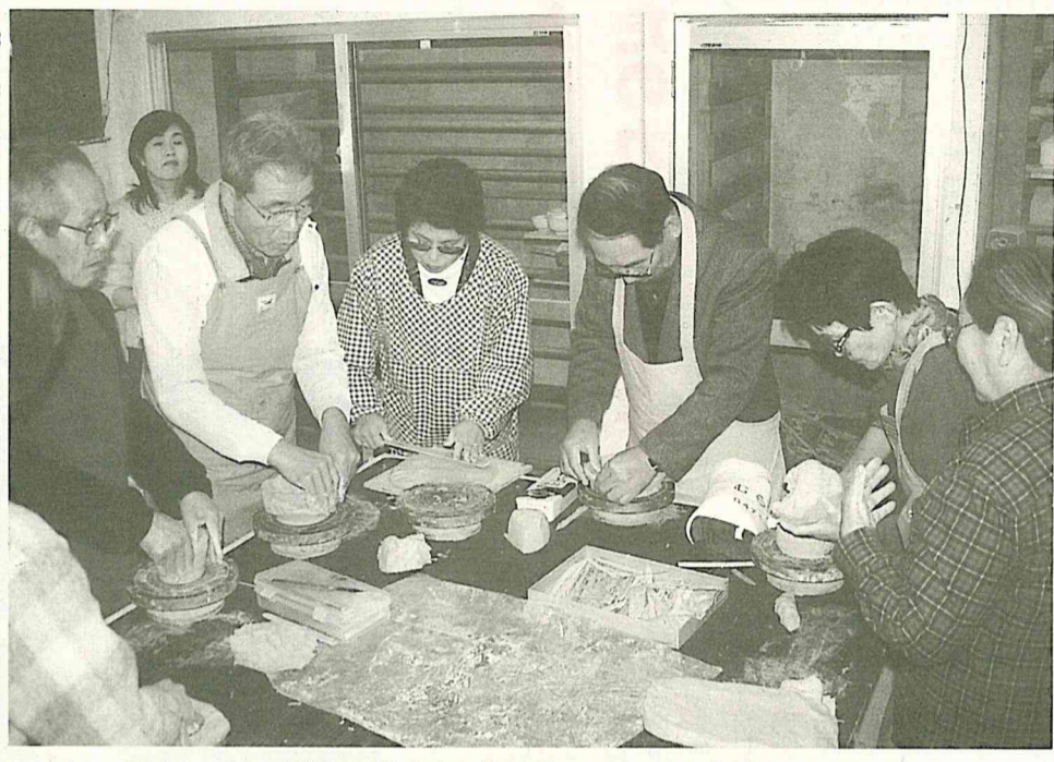
イメージを思い浮かべ作陶に熱中する参加者。1ヵ月後の仕上がりが楽しみ

気温が下がり、空気が乾燥するこの季節、風邪やインフルエンザが流行しやすくなります。 「かかったかな」と思ったら風邪だと軽く考えず安静にして休養をとり、早めに医師の診断を受けることが大切です。 また、予防策として①こまめに手を洗い、うがいをする②バランスのよい食事と十分な睡眠をとる③室内を乾燥させない④なるべく人込みを避ける——などに注意しましょう。 保健推進課 ☎54-0331