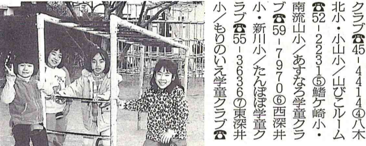
外で元気に遊ぶ江戸川台子どもルームのお友だち(左) みんなと一緒にとおやつもおいしいね(右)

学童保育所では、ことし四月から入所を希望する児童を募集します。学童保育所は、小学一～三年生の児童を、両親が共働きなどの理由で下校後、家庭保育ができない場合に児童を預けることのできる場所です。 【公立】 ▽対象学校区／学童保育所 名 江戸川台小・西初石小 江戸川台子どもルーム 54-2277 申し込み 2月29日まで 児童家庭課で手続きを現在入所している児童も手続きが必要です 園児家庭課 50-608 2 【自主運営】 ▽対象学校区／学童保育所 名 ①東小・向小金小／たけの子ルーム 73-9313 ②