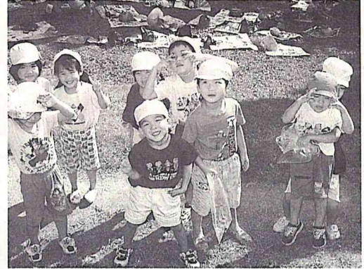
みんなと楽しく遊ぼうね

来春入所(園)の園児募集 今月19日から受け付け 来春四月から公立保育所と私立保育園に入 所(園)を希望する幼児を募集します。 申し込みは、今月十九日から市役所児童家 庭課と各保育所(園)で受け付けます。 現在通っている保育所(園)に継続して通っ ている保育所(園)に「状況調査票」を提出し てください。 また、保育所(園)の変更を希望する方は、 「状況調査票」にその旨を記入し、「申込書」 と共に、現在通っている保育所(園)または児 童家庭課に提出してください。