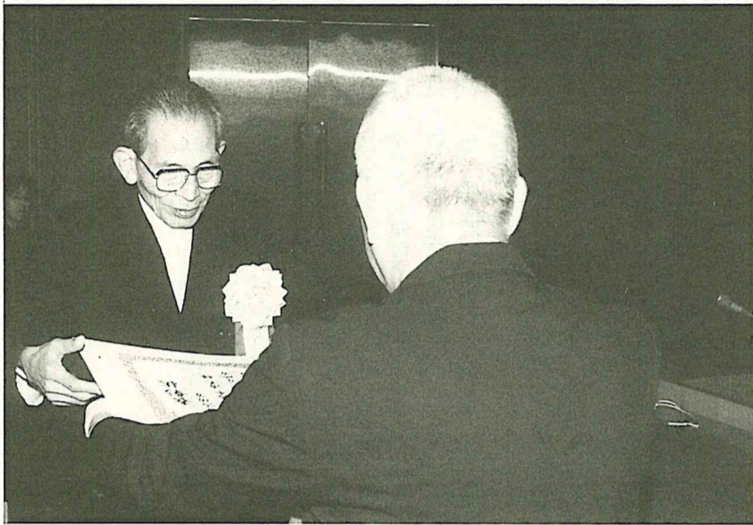
本市発展にご尽力された功績をたたえ、受賞者一人ひとりに表彰状と記念品が贈られた

ふるさと流山の発展に多大な貢献をされた方の功績をたたえる、平成十一年度の「流山市表彰式」が十一月三日、市役所市議会議場で行われ、十四人が受賞の栄に輝きました。この表彰は、それぞれの功績を郷土の歴史に刻み、永くその栄誉をたたえるもので、昭和四十八年に創設された本市最高の顕彰制度です。