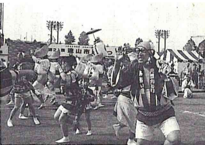
阿波踊りやふれあい動物コーナーなど盛りだくさんの一日