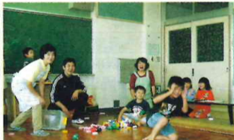
学校の余裕教室を活用した学童保育（平成11年度開設）

地方分権の推進や新たな行政需要に対応するため、新たな庁議制度を確立するなどスリムで効率的な組織づくりに努めました。