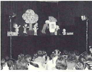
夢いっばいの人形劇

▽日時 11月5日(金)15時 ▽会場 初石公民館 演題 「ばけくらべ」ほか 出演 人形劇団ふうせん 中央図書館 59-464