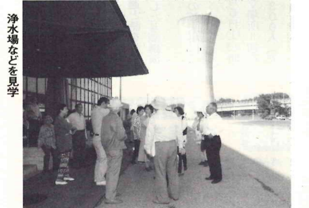
浄水場などを見学

新しい基本構想では、「価値あるまちづくり」を基本理念とし、将来都市像を「豊かな自然や歴史・文化を活かし、市民が真の豊かさを実感できるまち」を「みんなでつくる価値ある流山」としています。また、将来都市像の実現に向け、