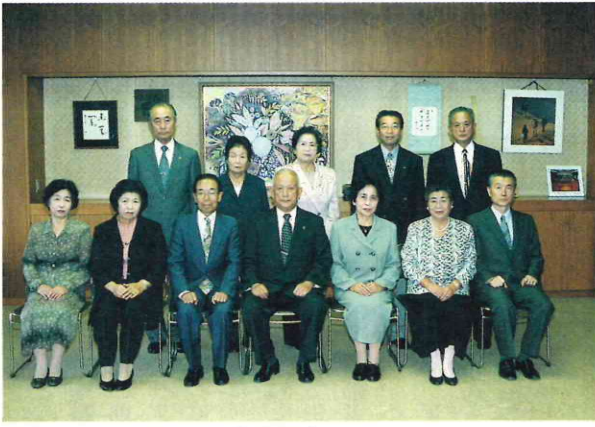
表彰式に出席した功労者の方々