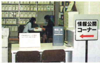
開かれた市政を目指し情報公開条例を施行（平成9年度）

事務量調査を実施し、事務量の変動に対応した柔軟かつ適正な職員の配置に努めました。