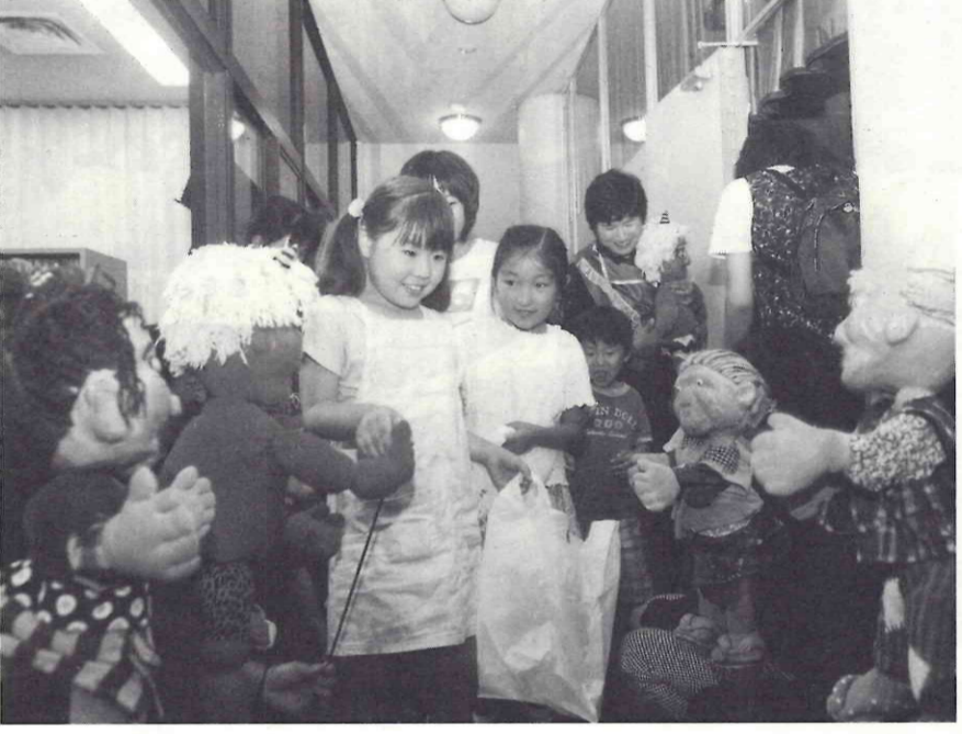
人形たちも皆さんの来場を待っているよ

豊かな生涯学習都市を目指し、今年二十日、二十一日に「流山まなびフェスタ」を開催します。