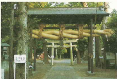
見事に据えられたしめ縄