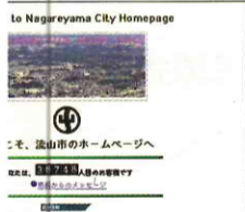
発信基地としてインターネットを開設（平成9年度）