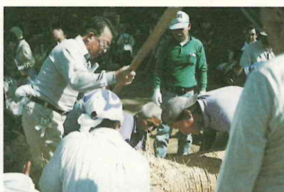
息を合わせてのしめ縄づくり