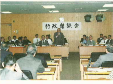
市民と懇談する流山市長