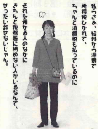
滞納しない、正しい納税。