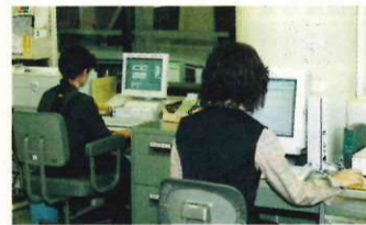
オンラインネットワークを拡充（平成9年度～）

市税などの収納体制の強化を図るとともに、ごみ収集事業の有料化など、使用料・手数料の見直しを行い、財源の確保に努めました。また、時間外勤務手当、管理職手当などの削減により経費を節減しました。