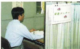
収納相談窓口を開設（平成8年度）

社会に対応した職員の向上を図るための研修や、政策立案一層の充実を図るため、政策ダイアログの決定しました。