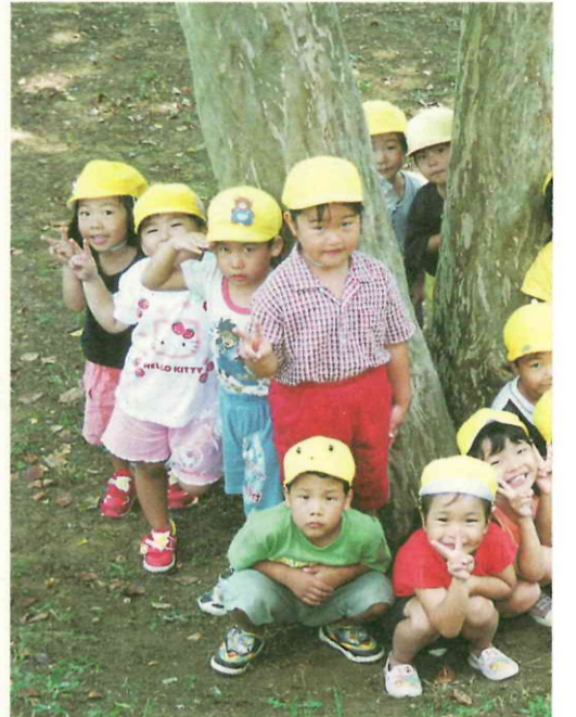
一層スリムで効率的な行政を目指し