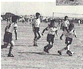
女子チームもファイトあふれるプレー

スポーツを通じて、姉妹都市の友好の輪をさらに広げようと、福島県相馬市と本市の子どもたちによる交歓試合が、七月二十四日から八月九日にかけて、両市を会場に開かれました。 交流を行ったのは、野球、サッカー、剣道。本市の上耕地運動場で行われた少年サッカー交歓試合には、相馬市から八チームの百四人が参加。女子サッカーチームやママさんチームも参加し、男子の子に負けないファイトあふれるプレーで会場を沸かせました。 そのほか、本市総合体育館では剣道が、また、本市の少年野球二チームが相馬市を訪れ、それぞれ交流を深めました。 この交流は、昭和六十年から行われているもので、今年で十五回目。