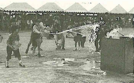
子どもたちも参加して初期消火訓練

地震は、いつ発生するかわかりません。いざという時、慌てず機敏な行動で被害を最小限に食い止めるためにも、多くの市民の皆さんの参加をお願いします。