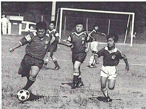
交歓試合とはいえ真剣にプレーする選手たち