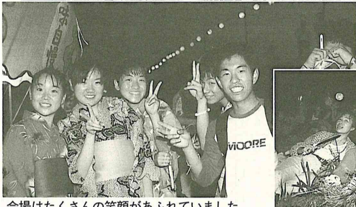
会場はたくさんの笑顔があふれていました