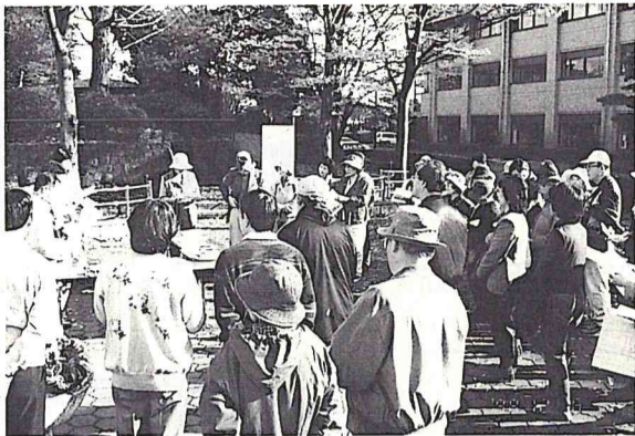
昨年行われたタウンウォッチング

「まちづくり創生塾」の塾生を募集しています。この10月からスタートする創生塾の参加者については、既に募集したところですが、定員に余裕がありますので追加募集します。