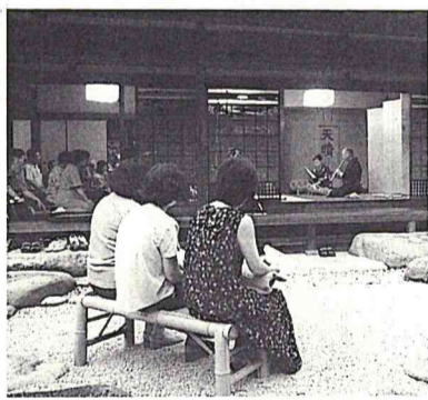
優雅な調べを満喫する市民

第13回相馬市長杯争奪少年野球大会が、6月26日から市総合運動場などを舞台に行われました。参加したのは19チーム。7月20日に行われた決勝戦では、春に県大会3位となった長崎フレンズと加岸ベアーズが熱戦を展開。その結果、12対7で加岸ベアーズが見事、初優勝を飾りました。 優勝した加岸ベアーズは、11月に行われる第15回少年野球千葉県選手権大会に出場します。