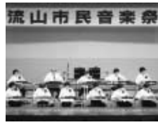
昨年の市民音楽祭より

期日：5月20日(日) 会場：文化会館 参加資格：市内で音楽活動を行い、発表に伴う準備・進行ができる団体 賞利、政治、宗教活動を目的とした団体は参加できません