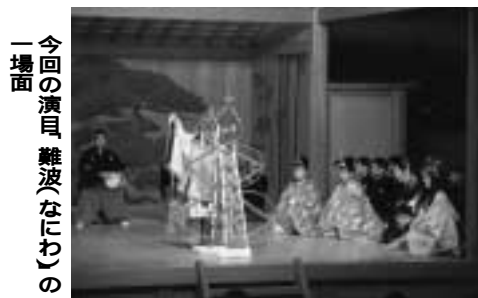
今回の演目「難波(なにわ)」の一場面

期日: 3月7日(水) 公演場所: 国立能楽堂(東京都渋谷区) バス乗車場所(時間): 江戸川台駅西口(8時30分) - 流山駅東口(8時45分) 東部公民館(9時00分) 対象/定員: 市民/45人(多数抽選) 参加費: 2,630円(返信ハガキ到着後、銀行振り込み) 交通手段: 市教委バス 申込方法: 往復ハガキに「古典芸能鑑賞会参加希望」、住所、氏名、年齢、性別、電話番号、乗車場所を明記(返信用にも住所、氏名を記入)し、1月31日(消印有効)までに〒270 0192 流山市役所社会教育課へハガキ1枚で2人まで記入可 問社会教育課: 50-6106