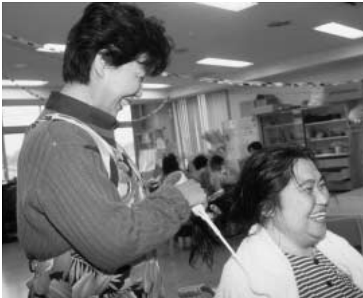
利用者の方との会話も弾む

「ボランティア国際年」は、ボランティア活動をみんなに知ってもらい、参加しやすい社会の仕組みを整え、ボランティア活動をもっと盛んにしようとする世界で取り組むキャンペーンです。