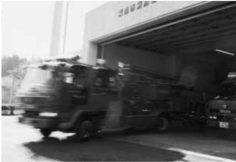
火災が発生したときは直ちに現場へ急行

冬は空気が乾燥し、火災が多発します。何かと忙しく火の元への注意も怠りがちです。消防本部、消防署、消防団では今月二十五日から三十一日まで、「歳末火災予防特別警戒」を展開します。期間中は、市内全域で消防車両などによる警戒パトロールを展開します。主な火災原因は、放火・放火の疑い、ガスコンロの放