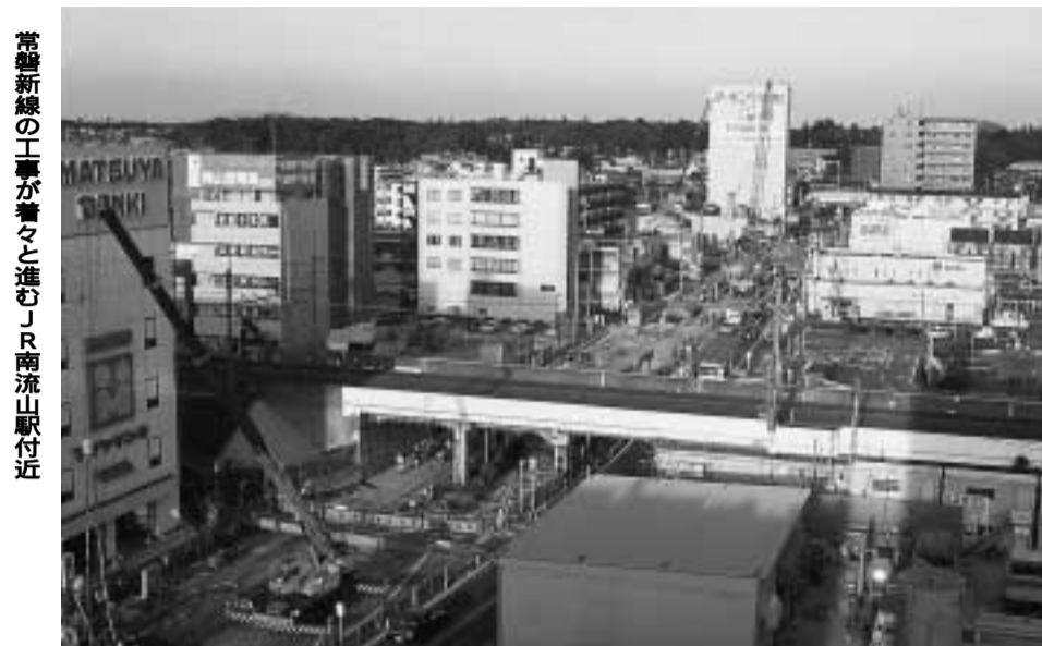
常磐新線の工事が着々と進むJR南流山駅付近

【常磐新線の進捗状況】 常磐新線は、平成十七年度の開業に向けて、一都三県の四十五か所で工事が進められており、平成十二年九月末時点の工事着手率は約五十五パーセントとなっています。 市内では、すでに江戸川橋梁工事や南流山駅周辺のトンネル工事が進められています。九月には区画整理区域外のすべての箇所の工事が発注されました。 また、都市基盤整備公団施行の新市街地地区内においては、新市街地の工事が来年の一月を目途に発注できるよう設計を進めていると聞いています。 さらに、同地区内の東武野田線新駅については、九月末に流山市、都市基盤整備公団、東武鉄道株式会社、首都圏新都市鉄道株式会社、日本鉄道建設公団の関係五者により、基本的な合意が得られました。