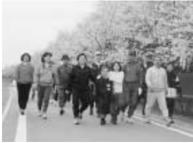
みんなで楽しくウォーキング

日時 11月5日(日)7時~(小雨決行) 集合場所/受付時間 初石駅前広場/6時45分~7時 参加費 300円(軽食代) 帰りの交通費は自己負担 持ち物 タオル、水筒、雨具、申し込み 当日直接集合場所へ 問 社会体育課 ☎59-1221