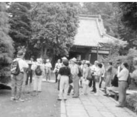
市内の史跡をのんびりと

日時 = 10月29日(日)9時30分~12時(小雨決行) 集合場所 = 市立博物館 コース = 江戸川土手 - 浅間神社(富士塚) - 近藤勇陣屋跡 -