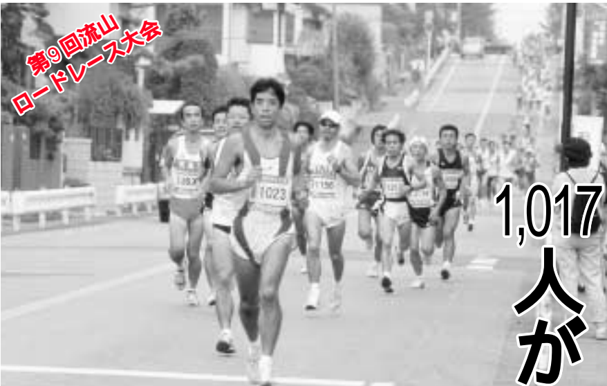
沿道からの声援を受けて力走するランナー