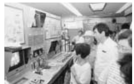
設備に見入る見学会参加者

期日 10月27日(金)(雨天決行) 集合場所(時間) 文化会館(9時) 東部公民館(9時20分) 見学先 あさみ苑(老人保健施設)、北千葉広域水道企業団、清掃事務所、流山工業団地 対象/定員 市内在住の方/30人(先着順) 持ち物 昼食、筆記用具、申し込み