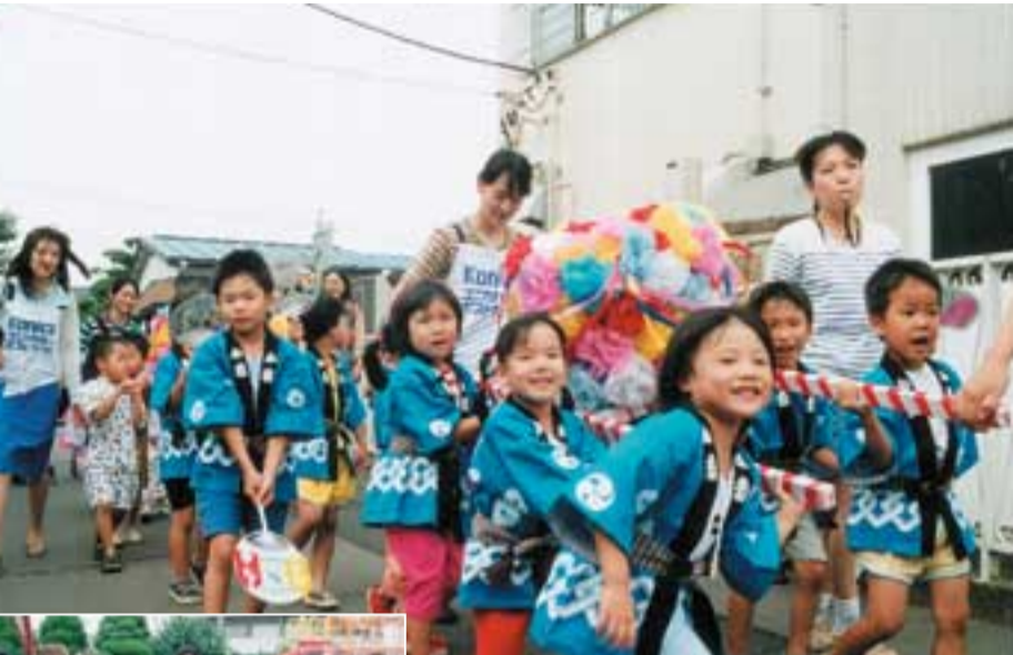
中野久木保育所父母会主催の「夏まつり」の様子。手づくりのみこしを力あわせて、「ワッショイ!!ワッショイ!!」ゲームコーナーでも大はしゃぎ

女性が職場進出が増える一方、仕事と育児との両立が難しいと考えている方、子育てについて不安や悩みを持つ方もいます。こうした問題に対応するため、国では「エンゼルプラン」、県では「千葉県子どもプラン」を策定し、子育て環境の充実を図っています。市でも、子どもの健全な成長と子育てを支援していくことが、少子化対策の出発点ではないでしょうか。