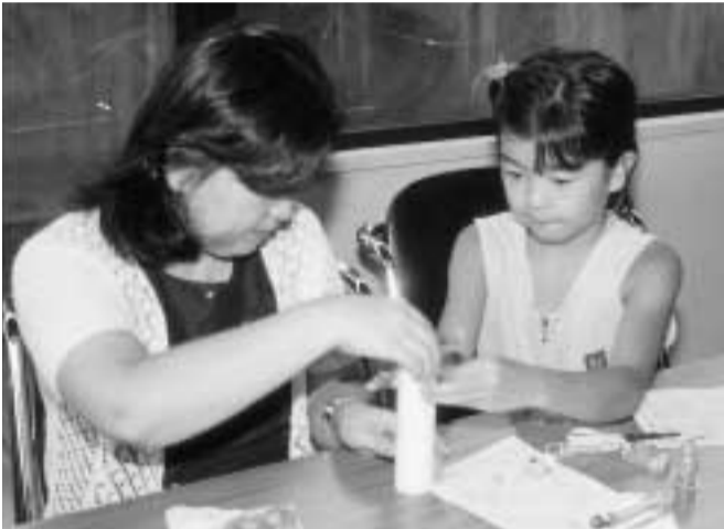
親子で楽しく科学の体験学習を