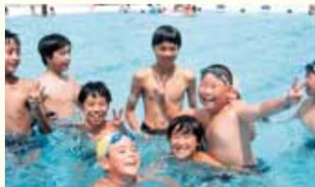
市民プールは子どもたちで大にぎわい

問 社会体育課 ☎59-1212 北部・流山・東部市民プールの開放時間等 8月1日～9月3日 1回目...10:00～11:30 2回目...12:30～14:00 3回目...14:30～16:00 4回目...16:30～18:00 9月1日・2日はのみ 8月6日は流山市民プールのみ閉鎖 【料金】 高校生以上 100円 小・中学生 50円