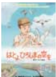
今回上映のビデオ

【夏休み親子ビデオ上映会】 日時「8月5日(土)14時～15時20分 場所「森の図書館 上映ビデオ」「はとよひろしまの空を」「サヨナラはお乳の匂い」 とモ アニメビデオ 入場料「無料 申し込み」当日直接会場へ 先着100人に記念品贈呈 【平和に関するポスター展】 期間「8月5日(土)まで 場所「森の図書館 入場料」無料 問企画調整課 ☎50 606