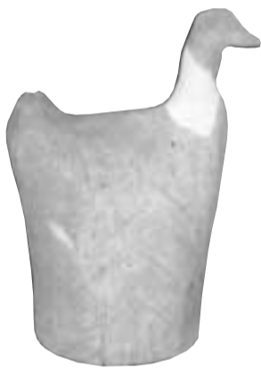
D鶏形埴輪...流山市東深井7号墳 6世紀中葉 現高25cm

馬や鶏の動物埴輪は多く出土するが、ムササビ形埴輪は極めて希で、空中を滑空する姿が見事に表現されている。