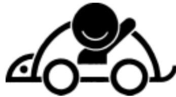
千葉県交通安全シンボルマーク

この運動は、交通事故の多発するこの時期に、交通ルールの遵守と正しい交通マナーの実践を習慣付けることにより、交通事故防止の徹底を図ることを目的としています。運動の重点目標は、「チャイルドシートとシートベルトの着用の徹底」、「子供と高齢者の交通事故防止」、「歩行者・自転車利用者の交通事故防止」、「スピードの出し過ぎ等無謀運転の防止」です。