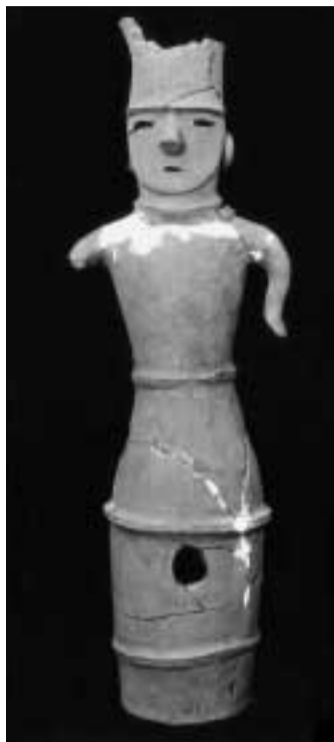
B人物埴輪...小見川町 6世紀後葉 現高77cm

ます。 展示期間 7月15日(9月17日) (月曜 祝日、8月31日を除く) 時間 9時30分～17時 入場料 無料