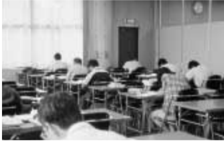
閲覧室のご利用を

図書館の利用者が多い夏休み期間中、図書館各分館と森の図書館では、臨時閲覧室を開設します。 また、中央図書館とコミュニティ図書館の閲覧室は従来どおり利用できます。 期間：7月21日(金)~8月30日(水)(月曜および初石分館は8月29日を除く) 都合により開設できない日もあります 時間：各分館：10時~16時50分 森の図書館：9時30分~17時 問い合わせは各館へ 問 南流山分館 ☎59 400 0/東部分館 ☎45 800 0/初石分館 ☎54 910 0/北部分館 ☎54 800 0/森の図書館 ☎52 320 書を持参 問 東洋学園大学図書館 ☎50 3001