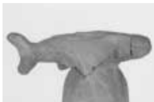
A魚形埴輪...流山市東深井7号墳 6世紀中葉 現高22cm

東深井古墳群(6世紀代の古墳群で13基の古墳がある)から出土したもので、全国的にも例の少ないもの。