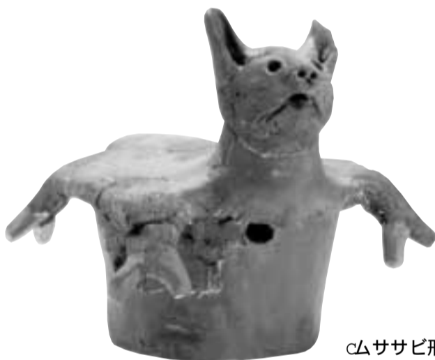
Cムササビ形埴輪...成田市 6世紀前半 現高23cm

東深井古墳群(6世紀代の古墳群で13基の古墳がある)から出土したもので、全国的にも例の少ないもの。