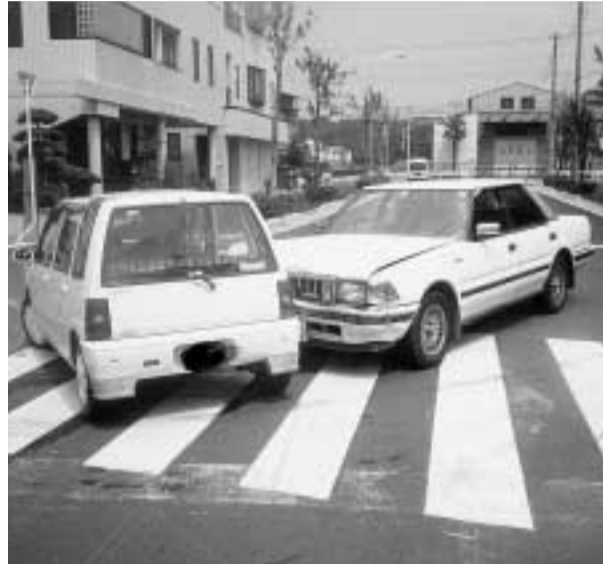
交通安全はあなた自身の交通ルールとマナーから

平成十一年中の千葉県内の交通事故による死者数は、全一七人を数え、四百二十二人もの尊い命が失われました。市内でも、六百五十五件の事故が発生し、六人が亡くなっています。