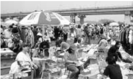
大賑わいのガラージセール

好評の「ガラージセール」を5月27日、江戸川河川敷多目的広場で開催します。市民による出店数は250店を予定。持ち寄られる品物は、書籍、衣類、おもちゃ、食器、電化製品など掘り出し物でいっぱいです。市民におなじみのリサイクルイベントです。お気軽にお立ち寄りください。 【日時】5月27日(土)9時～14時 雨天時は6月3日(土)に順延 【場所】江戸川河川敷多目的広場 問 リサイクル推進課 ☎50-6084